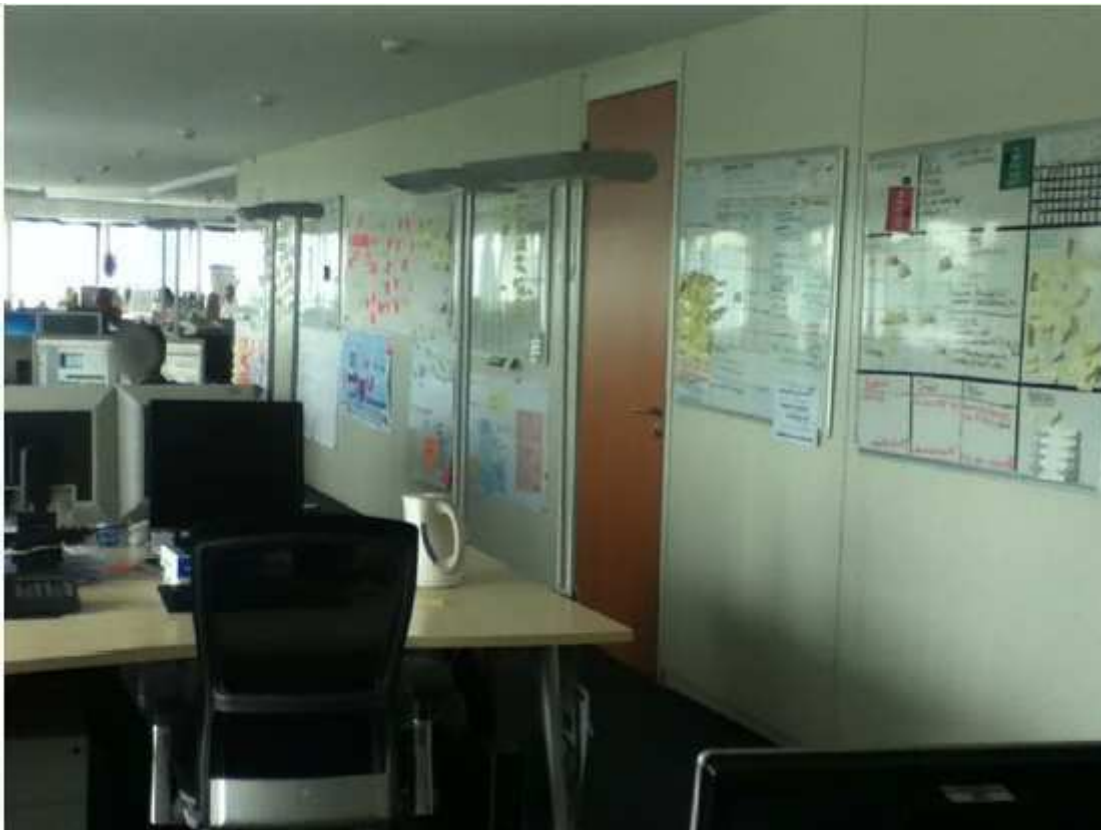
Figure 1: Whiteboards all over the open space

The seemingly exaggerated attitude of some consultants allowed this new colleague to mock the ideal consultant. He also humorously compared the whiteboard to a 'totem', which interestingly signifies – albeit ironically – a sacred object or emblem that represents the new group of internal consultants. As Butler (1999) points out, parodic behaviours denaturalize the promoted identity, break the boundary between the natural and the artificial, and stress performativity. The variations of perceived affordances entail various performances, preventing the social identity from being totally taken for granted and homogeneously internalized.