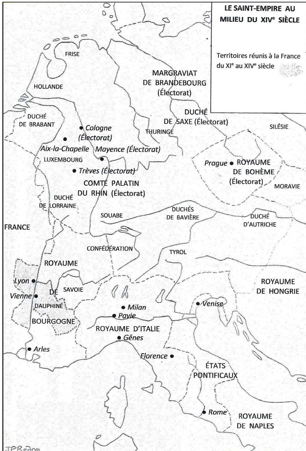
CARTE 1. Le Saint Empire au milieu du XIV e siècle.