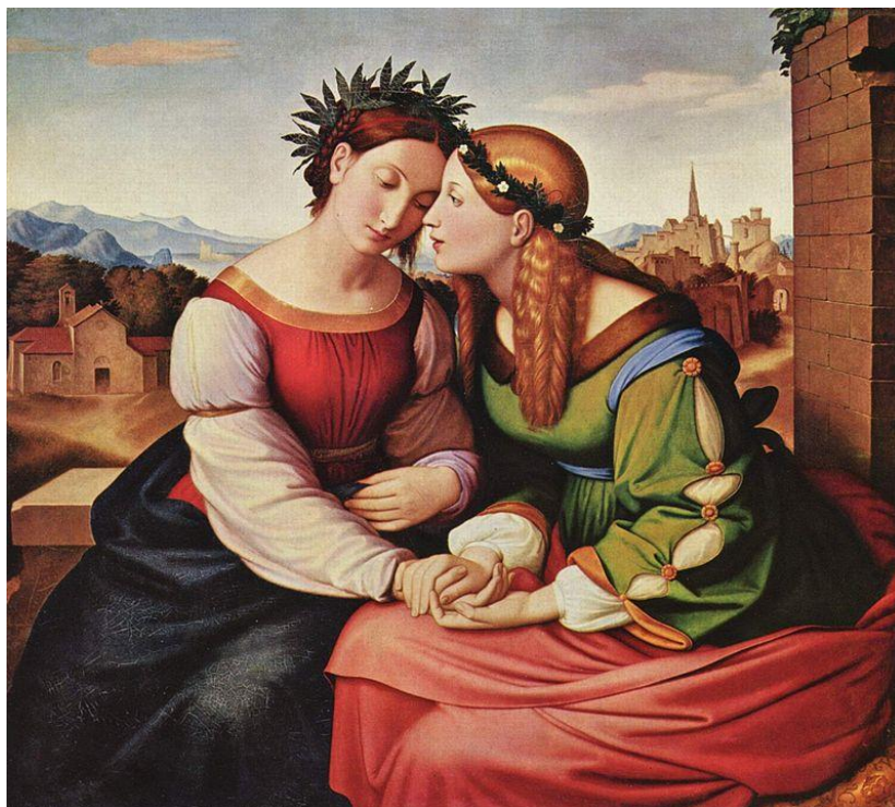
Friedrich OVERBECK, Italia und Germania , 1828, Munich, Neue Pinakothek.