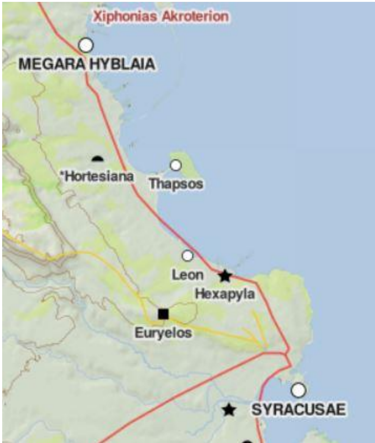
Coupe d'une carte de la Sicile orientale

De plus, ce passage semble d'autant plus un intertexte qu'il semble obéir à une stratégie d'écriture délibérée, car ici la géographie de Thapsos vient brouiller la géographie de Thapsus : cela fait se superposer l'idée d'un isthme étroit (στενόν ισθμόν) et d'une presqu'île (χερρόνησος) sur une localité pour laquelle ces concepts ne sont pas les plus adaptés 1017 , comme le montre la topographie des lieux :