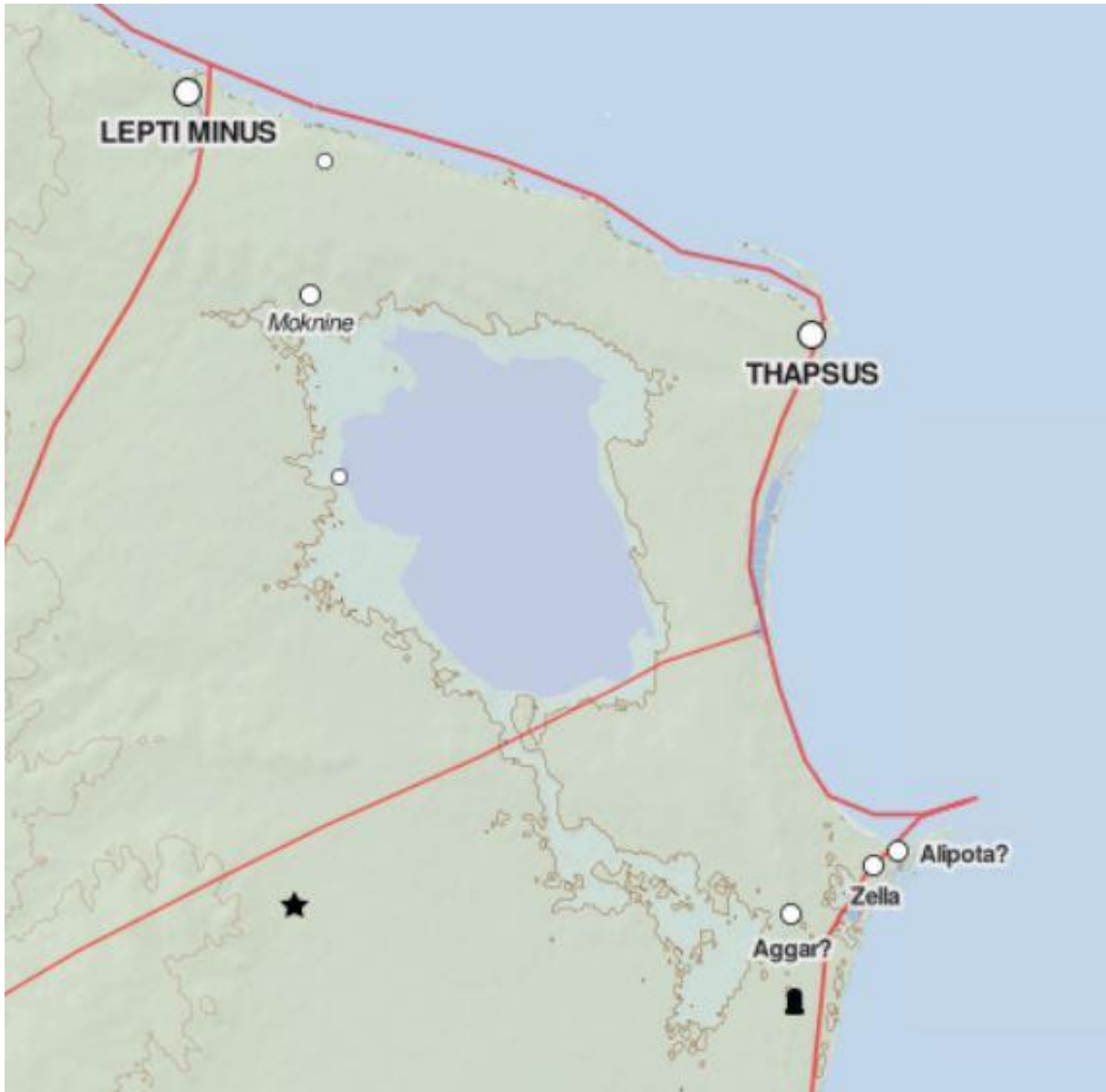
Coupe d'une carte de l'Afrique antique – région de Thapsus 1018

De plus, la présence d'un intertexte thucydidéen ne doit pas surprendre : l'influence de l'historien de La guerre du Péloponnèse sur Dion a été révélée dès l'Antiquité 1019 et étudiée depuis longtemps par les modernes 1020 , au point qu'aujourd'hui c'est un fait établi avec certitude que Dion a lu Thucydide et qu'il le connaît assez pour le citer consciemment ou inconsciemment 1021 . Or, plus récemment, E. Bertrand a montré que l' imitatio Thucydidis n'est pas seulement stylistique mais peut servir le projet historiographique de Dion 1022 .