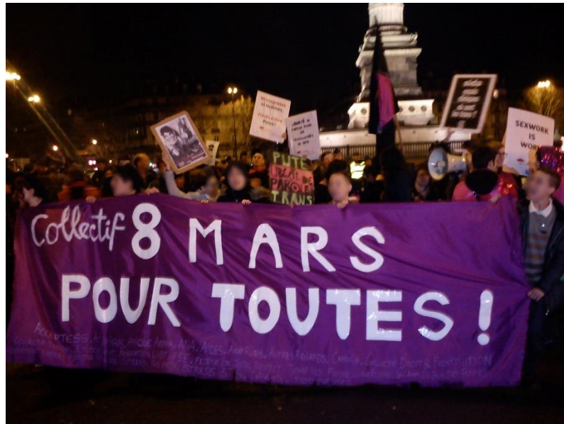
Photographie 11 : Le cortège du Collectif 8 mars pour toutes face aux manifestants abolitionnistes après la manifestation du 8 mars 2013

les laissent passer après eux 862 . A la fin du parcours, les confrontations entre les différents groupes militants reprennent, donnant lieu à un encerclement des militantes de 8 mars pour toutes par les banderoles portant les revendications abolitionnistes ainsi qu'à un concours de décibels.