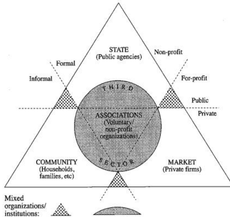
Figure 1: Triangle du bien-être (Evers et Laville 2004, pp. 15 et 17)

Ce triangle, ayant différentes interprétations dans la littérature (Evers 1990 ; Roustang et al. 1997 ; Pestoff 1992, cités par Evers et Laville pp. 15-17) représente schématiquement à ses extrémités les trois pôles de l'économie et leurs principes respectifs, empruntés à l'analyse de Polanyi. Ils ne sont pas représentés sur ce schéma, mais il s'agit de la réciprocité correspondant à la sphère domestique, la redistribution, correspondant à l'Etat et l'échange marchand correspondant au marché. Le tiers secteur est la sphère intermédiaire au centre et aux intersections entre ces différents pôles hiérarchisés. Les organisations du tiers secteur sont « influencées simultanément » par les logiques de ces pôles (Evers et Laville 2004, p. 15), ce qui produit deux types de relations caractérisant le rôle intermédiaire du tiers secteur. D'une part, du point de vue de l'interdépendance entre les sphères soulignées par Evers (1995), cela permet de caractériser cet espace intermédiaire comme ayant un rôle d'équilibre entre logiques, et d'autre part, cet espace intermédiaire est sujet à des tensions multiples .