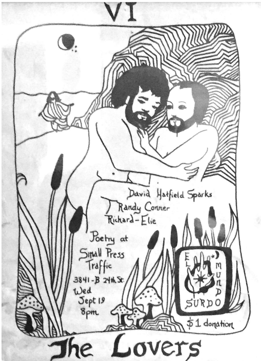
Figure 3 : Flyer pour El Mundo Surdo Reading Series, septembre 1979, par Randy P. Conner.