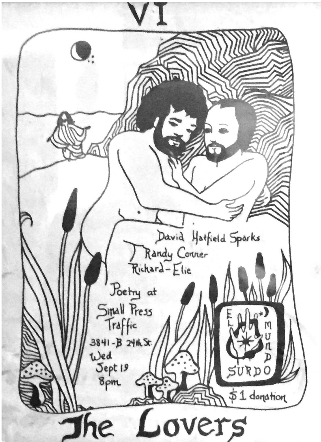
Figure 3 : Flyer pour El Mundo Surdo Reading Series, septembre 1979, par Randy P. Conner.