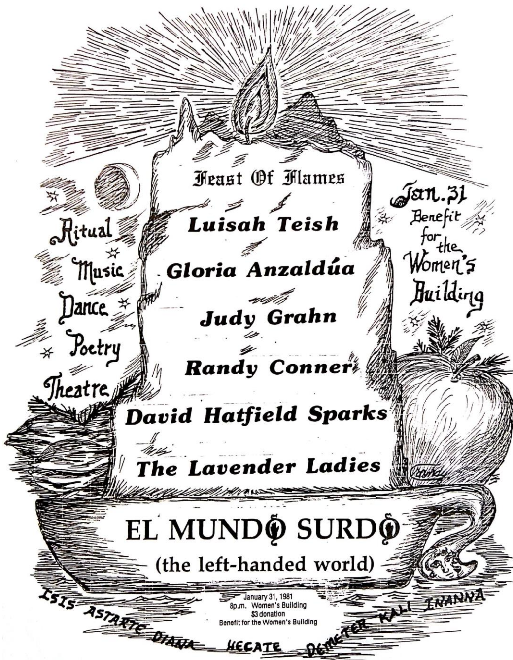
Figure 7 : Flyer pour la soirée de soutien au Women's Building, 31 janvier 1981, par Randy P. Conner.