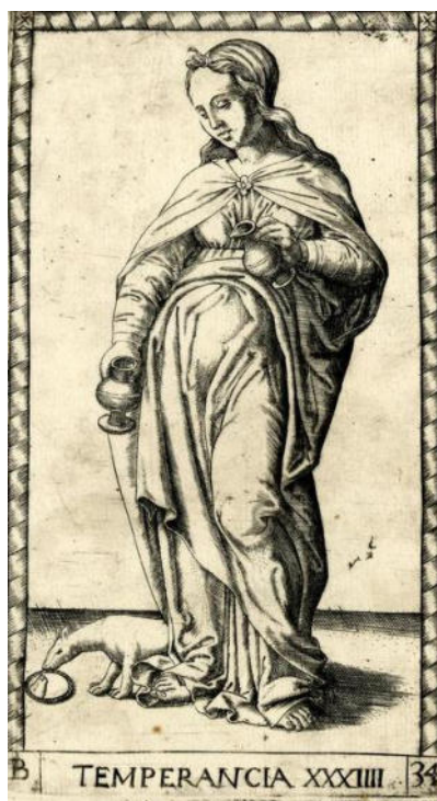
7. Temperanza, Tarocchi del Mantegna, incisione tedesca su carta (1530-1561). Fonte: https://www.britishmuseum.org/collection/object/P_1895-0617-135