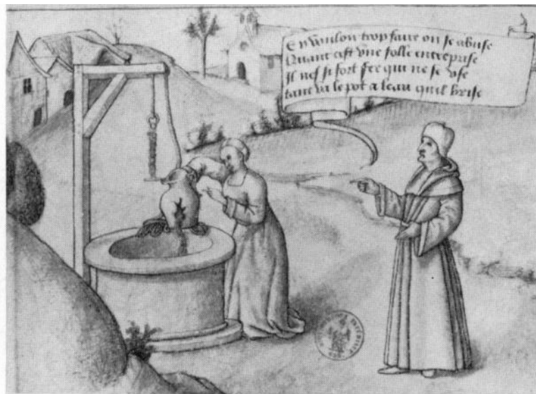
12. Tant va le pot à l'eau... , disegno, ca. 1510, Paris, Bibliothèque Nationale, Ms. fr. 24 461.

Fonte: Gisela ZICK, Der zerbrochene Krug als Bildmotiv des 18. Jahrhunderts , in «Wallraf-Richartz-Jahrbuch», 31 (1969), pp. 149-204: 150; URL:< https://www.jstor.org/stable/24655923 >; ultimo accesso 22/02/2023.