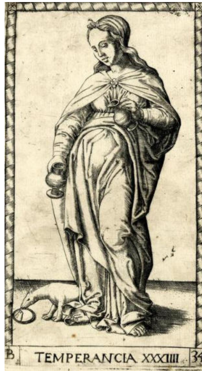
7. Temperanza, Tarocchi del Mantegna, incisione tedesca su carta (1530-1561). Fonte: https://www.britishmuseum.org/collection/object/P_1895-0617-135