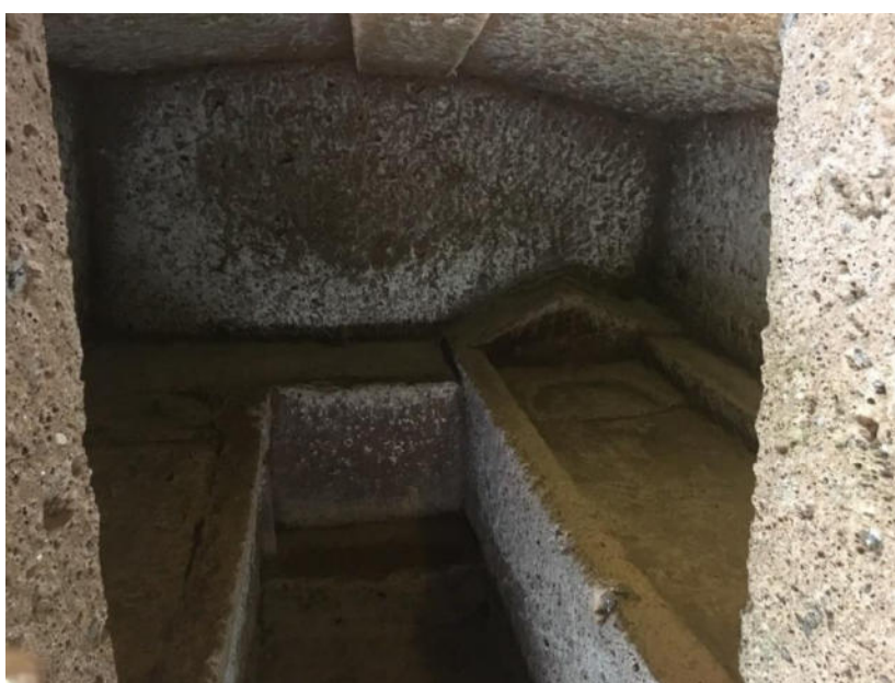
10. Giacigli funerari in un tumulo della necropoli di Cerveteri