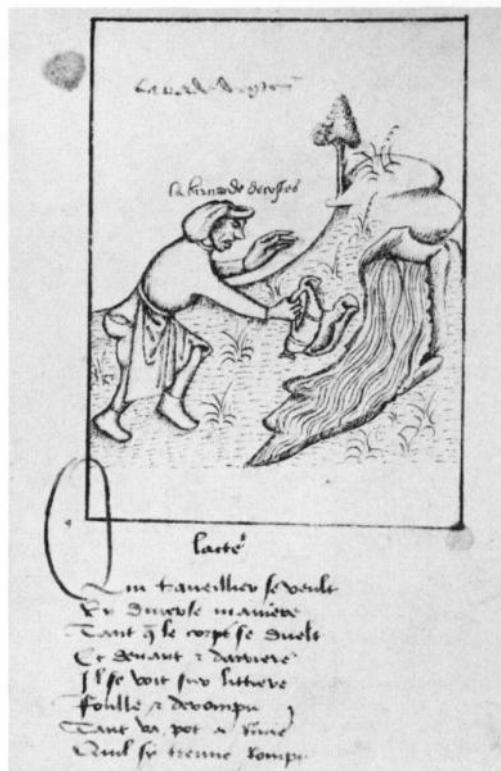
11. Tant va pot a riviere... , disegno, ca. 1485. Baltimore, Walters Art Gallery, ms. 313.

Fonte: Gisela ZICK, Der zerbrochene Krug als Bildmotiv des 18. Jahrhunderts , in «Wallraf-Richartz-Jahrbuch», 31 (1969), pp. 149-204: 150; URL:< https://www.jstor.org/stable/24655923 >; ultimo accesso 22/02/2023.