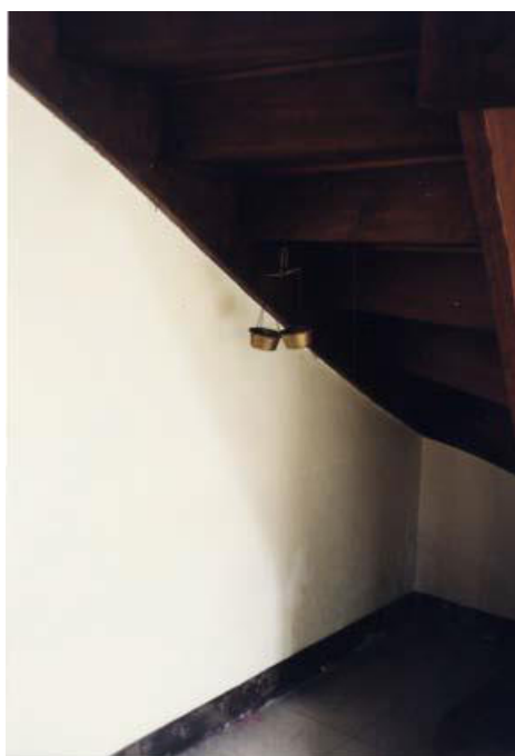
6. La «piccola bilancia» acquistata da Celan ad Amsterdam nel 1964.