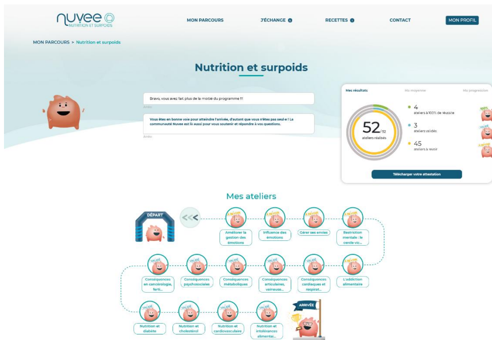
Figure 1 - Capture d'écran d'un parcours Nuvee sur la thématique « Nutrition-Surpoids »

Le parcours d'apprentissage est imaginé comme une succession de niveaux à passer, à la manière d'un jeu de plateau, représentés par les ateliers.