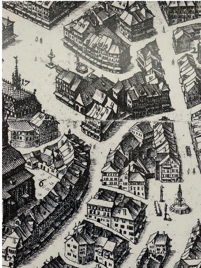
Figure 5 Plan de Bâle (Merian, 1615). Détail de la Marktplatz et du Fischmarkt. La maison "Zum Pfauen" occupe le centre de la scène.