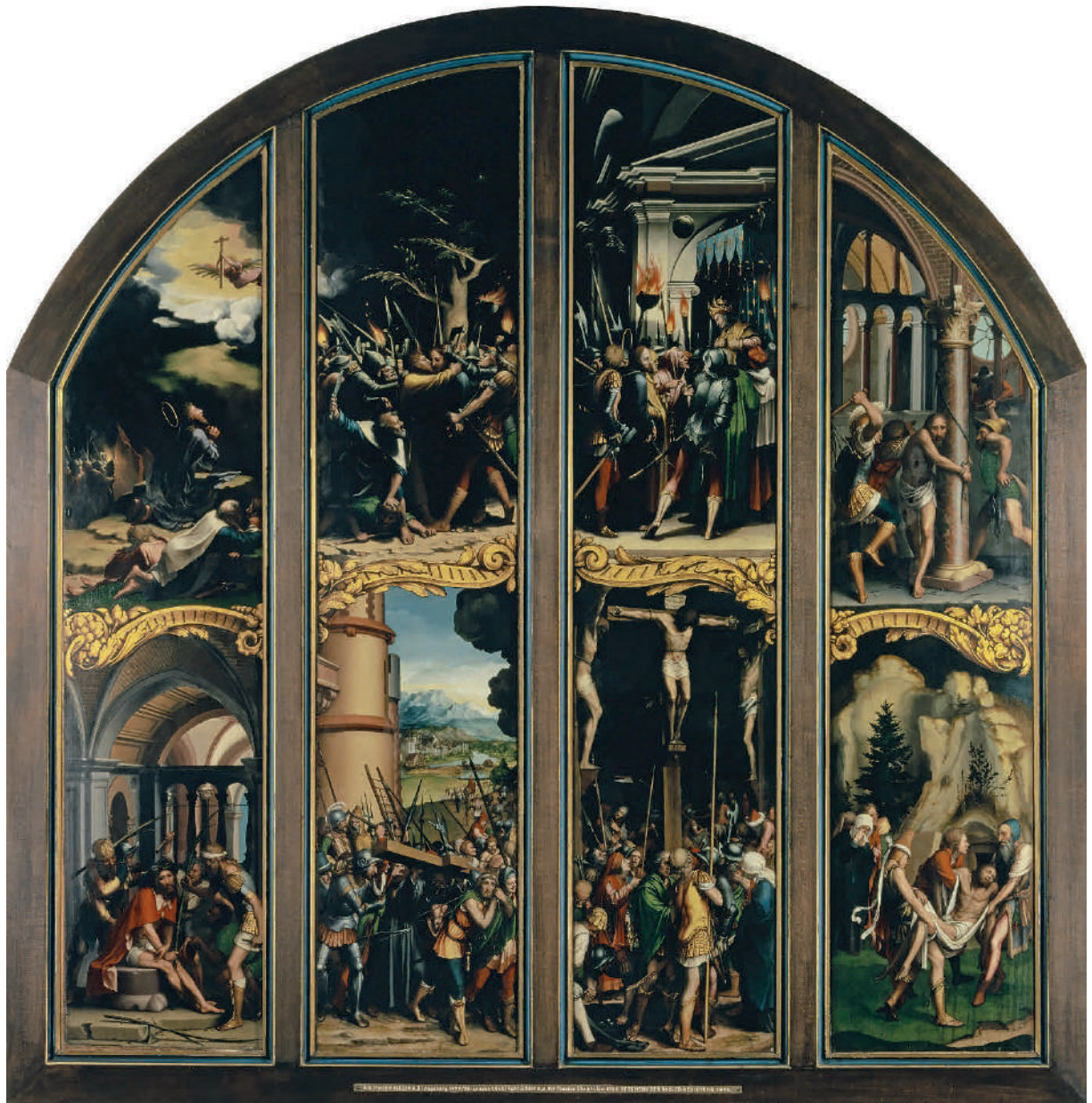
Figure 10 Rétable de la Passion du Christ, par Holbein, pour l'autel de Maria Zscheckenbürlin et Morand von Brunn (Kunstmuseum Basel)