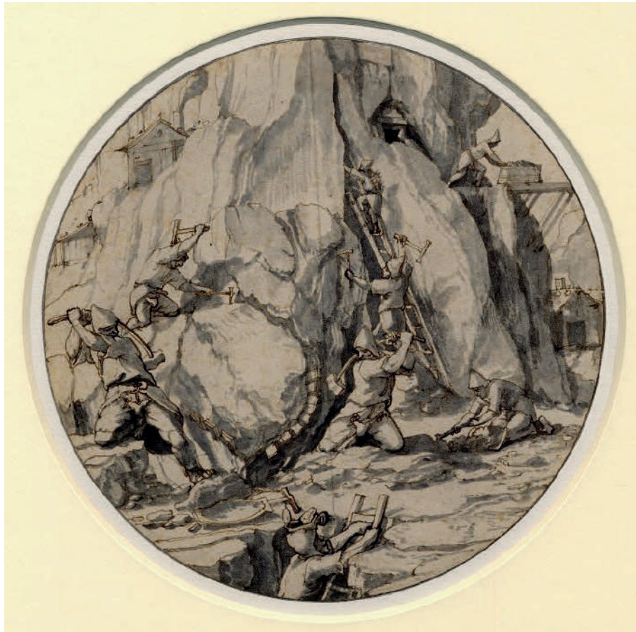
Figure 8 Dessin préparatoire d'après Holbein le Jeune (British Museum)