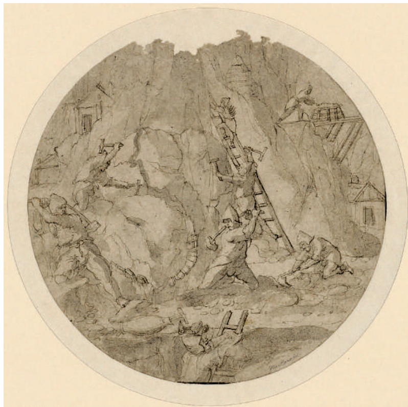
Figure 9 Dessin préparatoire d'après Holbein le Jeune (Kunstmuseum Basel)