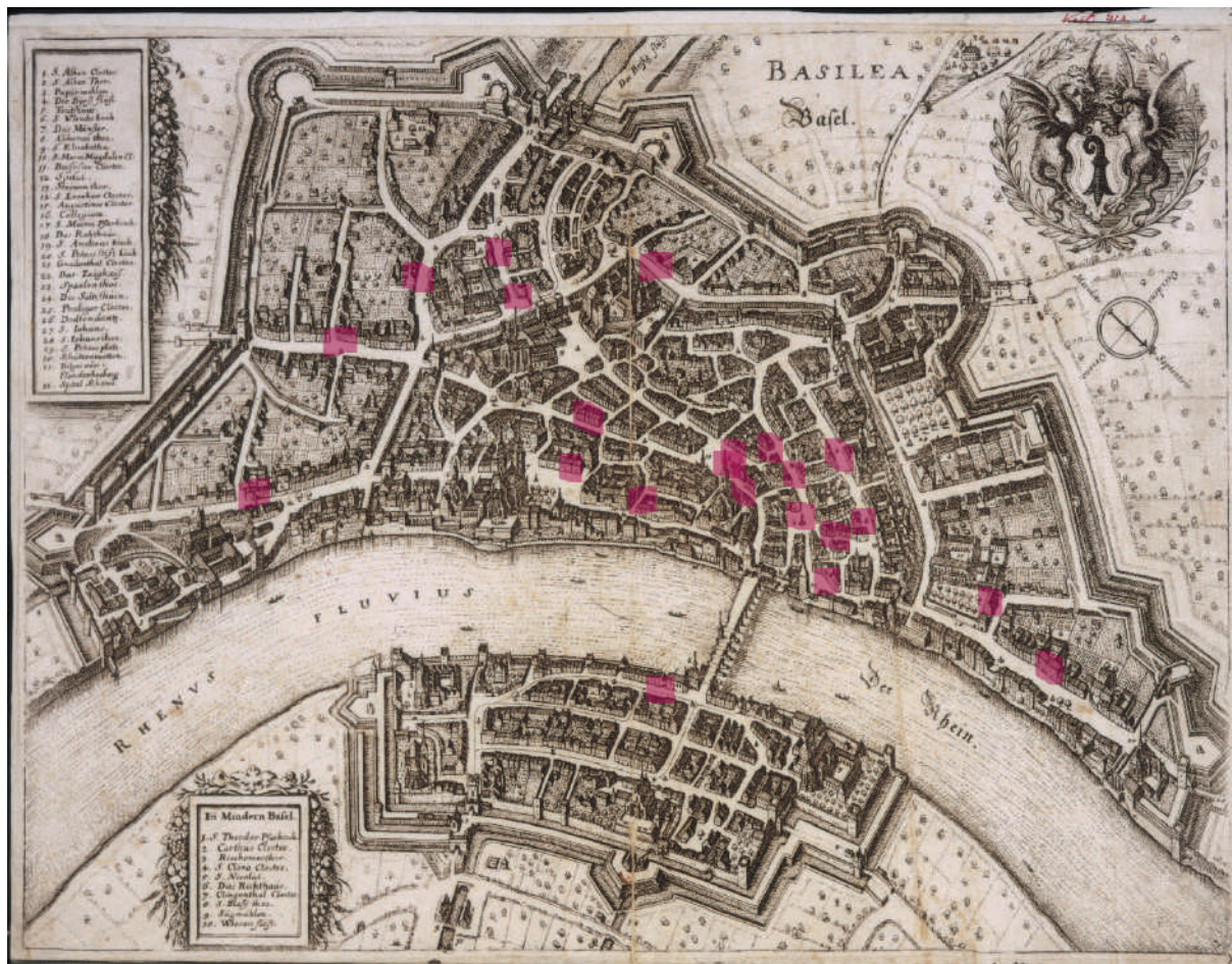
Figure 7 Plan de Bâle (Merian, 1615). Implantation des investisseurs miniers dans les quartiers de Bâle (localisation des sites : David Bourgeois) 23