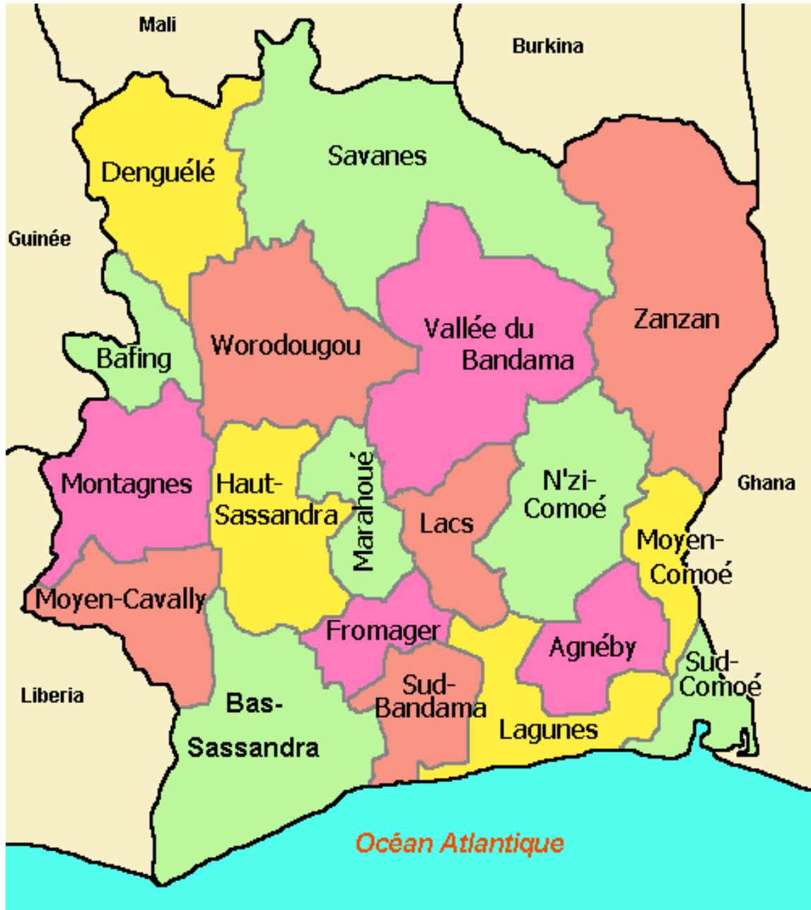
Carte de la Côte d'Ivoire