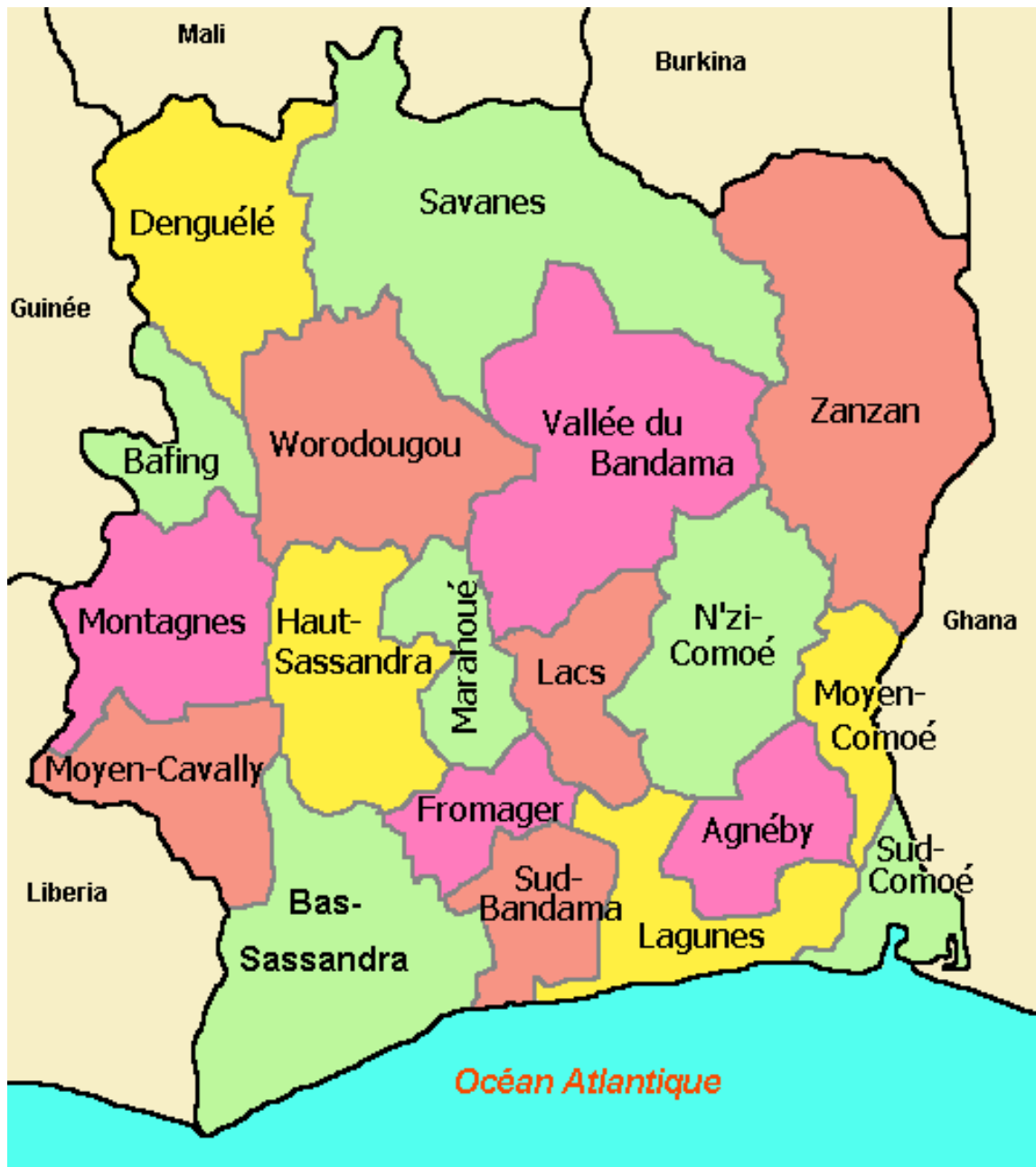
Carte de la Côte d'Ivoire