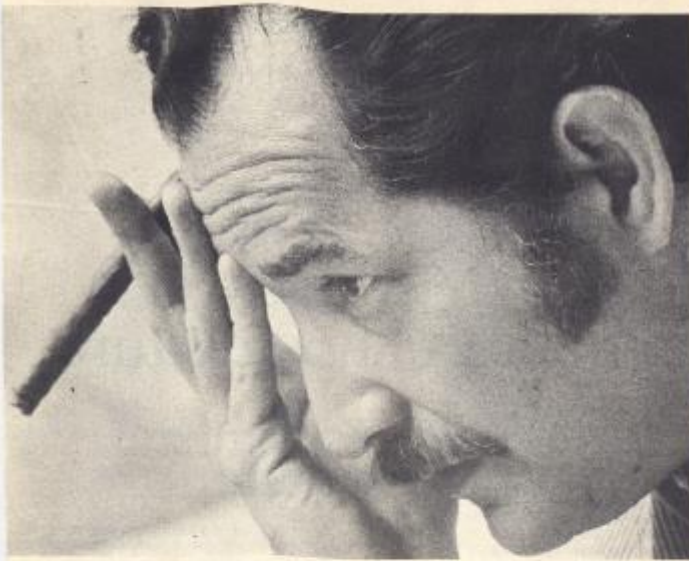
CARLOS FUENTES Le vrai sujet s'inscrit...