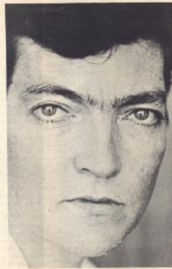
JULIO CORTÁZAR ...en juifrage