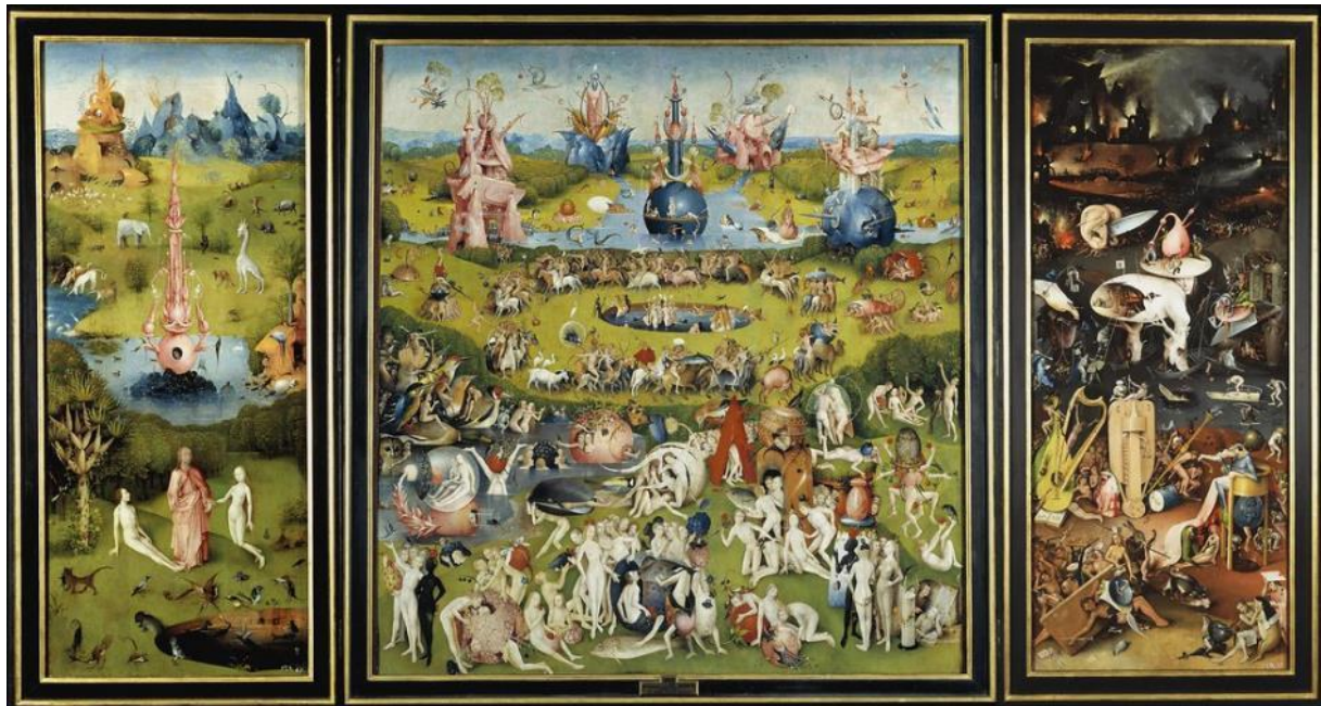
Bosch, Jheronimus. Tríptico del Jardín de las delicias . 1490-1500, Musée du Prado, Madrid.