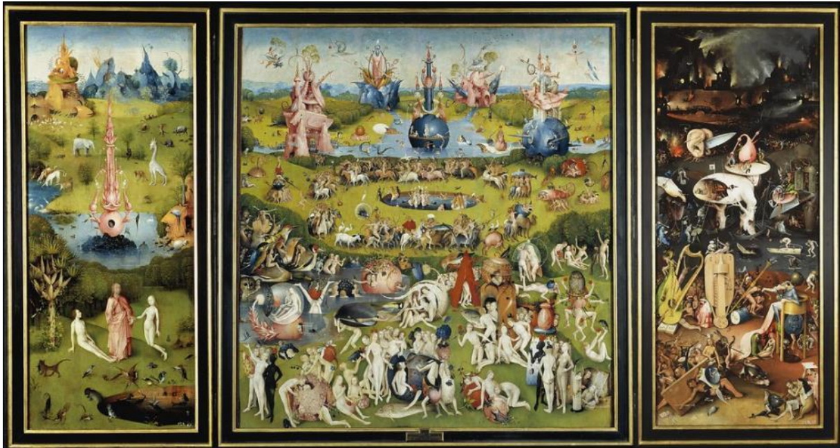
Bosch, Jheronimus. Tríptico del Jardín de las delicias . 1490-1500, Musée du Prado, Madrid.