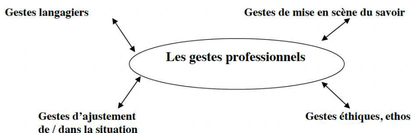
Matrice de l'agir du professeur

Les différents pôles peuvent être explicités et synthétisés ainsi :