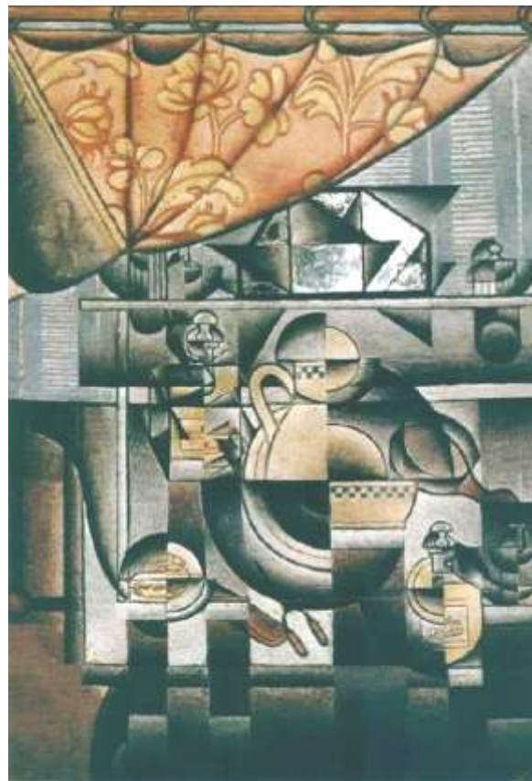
Ilustración número 2: Juan Gris, Le lavabo , 1912