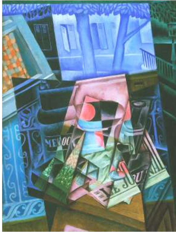
Ilustración número 1: Juan Gris, Naturaleza muerta ante una ventana abierta: Plaza de Ravignan , 1915.