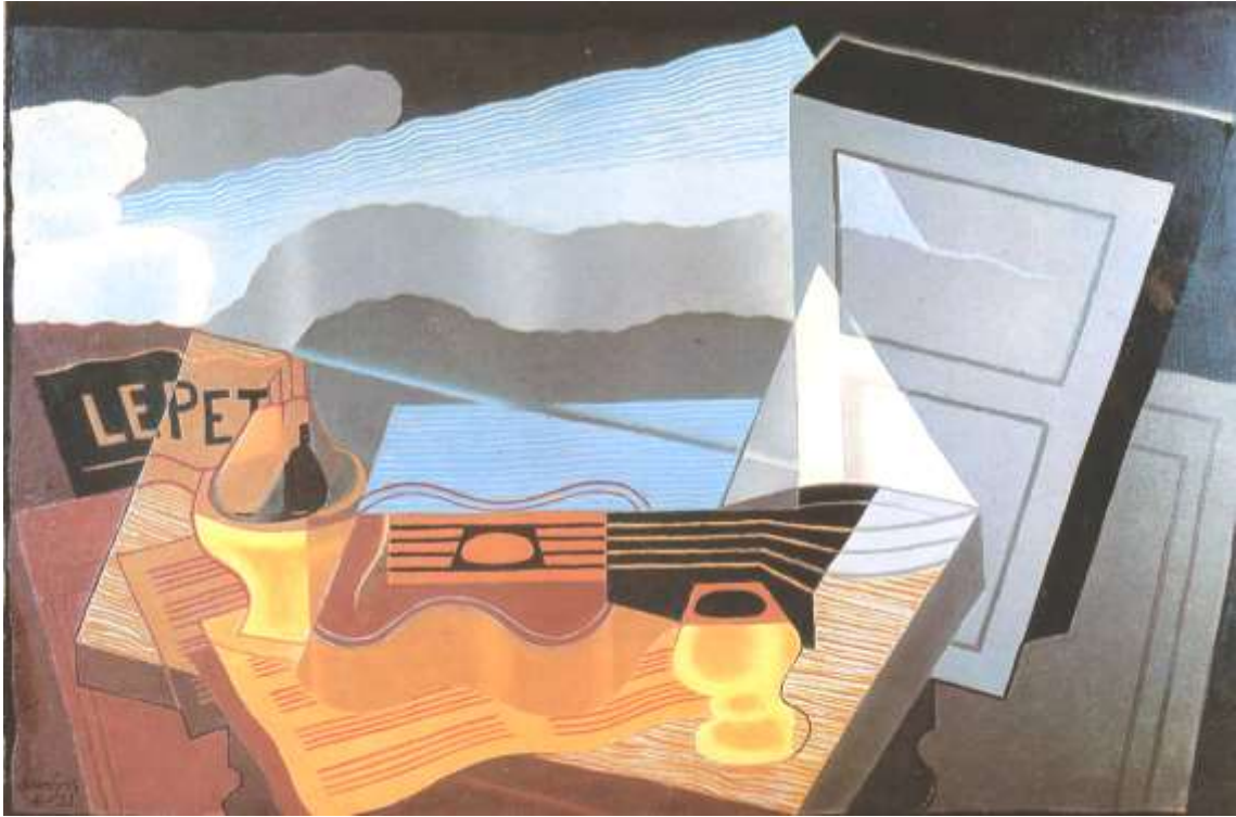
Ilustración número 3: Juan Gris, Vista de la bahía , 1921