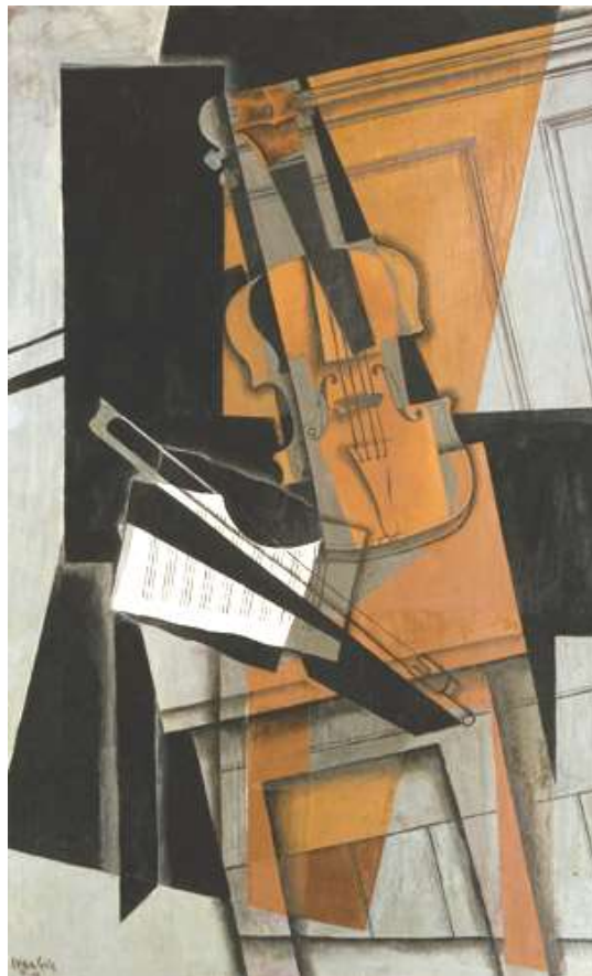
Ilustración número 4: Juan Gris, El violín , 1916