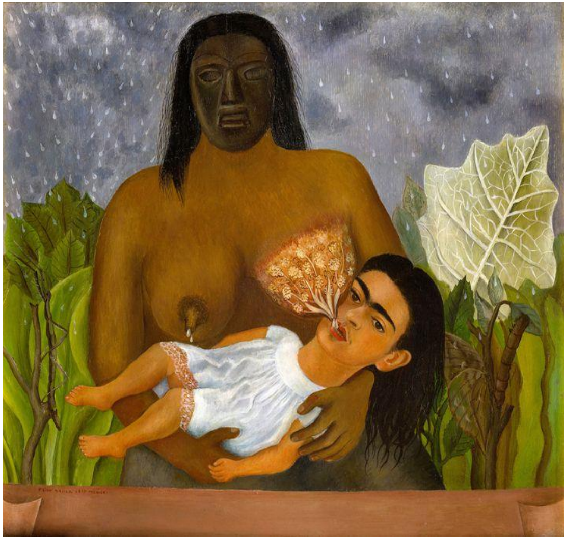
Mi nana y yo (Frida Kahlo, 1932)

Le rejet de Zoraida envers sa fille fait jouer à la nounou le rôle de mère. L'intention de la femme indienne est d'éduquer la protagoniste à travers un passé indigène et c'est à travers elle que la jeune fille découvrira plus tard que les femmes et les Indiens font partie de la société des marginaux, sans oublier les célibataires.