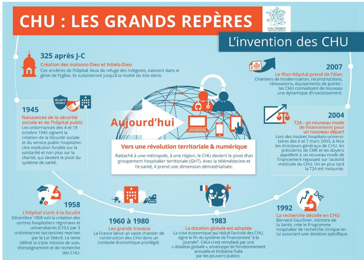
Fig. 1. Le CHU