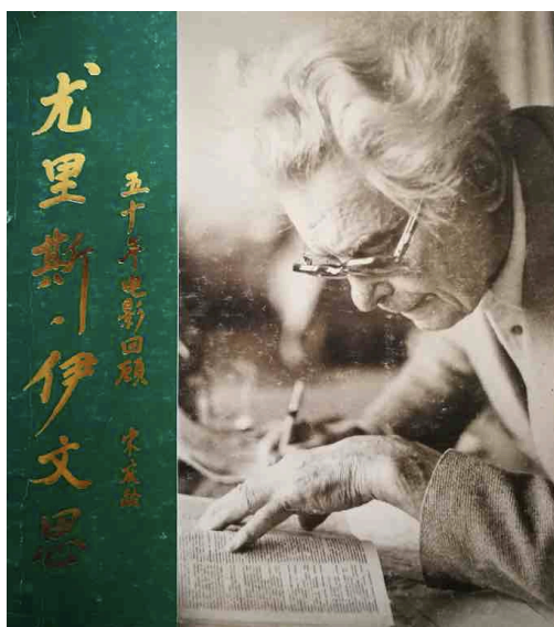
Ouvrage publié en Chine en honneur de Joris Ivens lors de sa rétrospective, le titre du livre est calligraphié par Song Qingling.

En 1984, la Chine entre dans une phase d'approfondissement de la Réforme et de l'ouverture, elle signe la déclaration conjointe sino-britannique sur la question de Hong Kong, Deng Xiaoping conduit les Chinois à s'engager dans une quête de richesse et d'autonomie, et la cinquième génération balaye tous les clichés maoïstes pour créer leur image de la Chine... Joris Ivens en est témoin. En mars 1985, Joris Ivens demande à la cinémathèque néerlandaise de suspendre les projections de Yukong . Cette même année, le tournage du Vent commence - c'est l'heure de tourner la page.