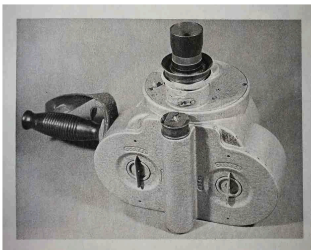
La caméra conservée dans le Musée national de la Chine

Pour Joris Ivens, ce don ne relevait pas d'un acte révolutionnaire réfléchi, qui est pourtant devenu la preuve du lien entre Ivens et le PCC. Il n'a pas réussi à être la première personne au monde à filmer la base de Yan'an, mais sa caméra y est présente et participe, dès ses débuts, à la construction de l'industrie cinématographique du PCC. En ce sens, Joris Ivens est un vieil ami du PCC, sans aucune ambiguïté.