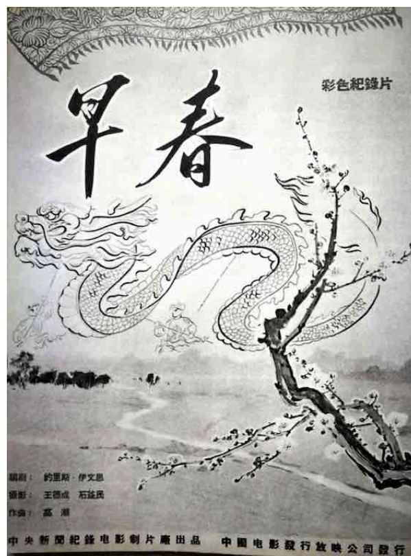
L'affiche de Lettres de Chine , publiée dans le catalogue de la rétrospective de Joris Ivens en Chine.

Lettres de Chine est aussi l'œuvre qui a le plus touché les Chinois à sa sortie, parce que c'est la seule qui sort publiquement en Chine juste après son achèvement, et sur le plan esthétique, son interprétation emporte l'adhésion d'un large public populaire. Les Chinois ont un complexe envers l'Occident, d'autant plus qu'en matière de cinéma, l'Occident est depuis toujours leur maître. Par conséquent, quand Joris Ivens, « grand réalisateur occidental » est venu apprendre l'art chinois et l'utilise dans son film sur la Chine, c'est considéré comme une sorte de victoire culturelle chinoise, enfin reconnue sur le plan international. Le Quotidien du Peuple s'en fait l'écho à plusieurs reprises : « N'appliquer pas sèchement sa propre logique sur le peuple d'un autre pays ; apprendre la sagesse de l'Autre pour l'intégrer dans ses propres oeuvres-d'art, ça, c'est le vrai esprit d'internationalisme en création artistique 682 ».