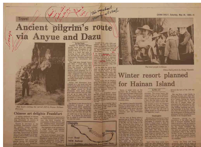
Note de Joris Ivens sur China Daily, du 24 mai 1984. Il filme, pour le Vent, les bouddhas dont parle Han Suyin dans cet article.

Une histoire de vent , Florence , Le Toit du Monde , sont donc des variations d'une même idée : un ciné-poème de l'histoire de Joris Ivens, sa vision du monde, de l'espace et du temps, ainsi que ses amours et ses doutes.