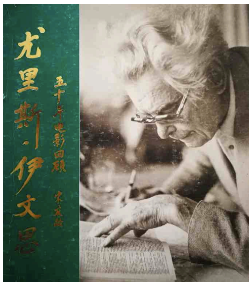
Ouvrage publié en Chine en honneur de Joris Ivens lors de sa rétrospective, le titre du livre est calligraphié par Song Qingling.

En 1984, la Chine entre dans une phase d'approfondissement de la Réforme et de l'ouverture, elle signe la déclaration conjointe sino-britannique sur la question de Hong Kong, Deng Xiaoping conduit les Chinois à s'engager dans une quête de richesse et d'autonomie, et la cinquième génération balaye tous les clichés maoïstes pour créer leur image de la Chine... Joris Ivens en est témoin. En mars 1985, Joris Ivens demande à la cinémathèque néerlandaise de suspendre les projections de Yukong . Cette même année, le tournage du Vent commence - c'est l'heure de tourner la page.