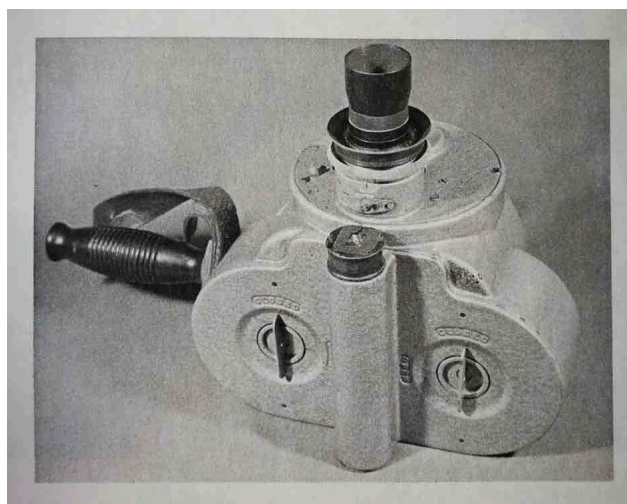
La caméra conservée dans le Musée national de la Chine

Pour Joris Ivens, ce don ne relevait pas d'un acte révolutionnaire réfléchi, qui est pourtant devenu la preuve du lien entre Ivens et le PCC. Il n'a pas réussi à être la première personne au monde à filmer la base de Yan'an, mais sa caméra y est présente et participe, dès ses débuts, à la construction de l'industrie cinématographique du PCC. En ce sens, Joris Ivens est un vieil ami du PCC, sans aucune ambiguïté.