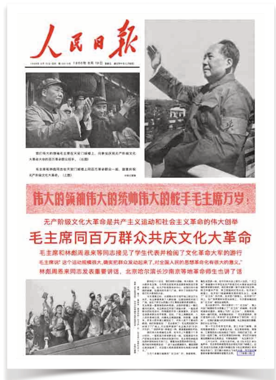
La Une du Quotidien du peuple , du 19 août 1966 : La réception des Gardes rouges par Mao et Lin Biao.

Les cadres du parti (les opposants, réels ou supposés, au chef suprême), les intellectuels, les artistes, ainsi que tous ceux qui font partie des « Cinq catégories noires 720 » sont violemment attaqués. Souvent, les Gardes rouges leur font faire leur auto-critique, qui serait ensuite retenue comme élément à charge lors de leur procès. La plupart d'entre eux sont exécutés en public à titre d'exemple ou exilés dans des camps de travail (« goulag » chinois), où ils meurent à la suite de mauvais traitements - ces atrocités sont hélas nombreuses. De nombreux intellectuels de renom