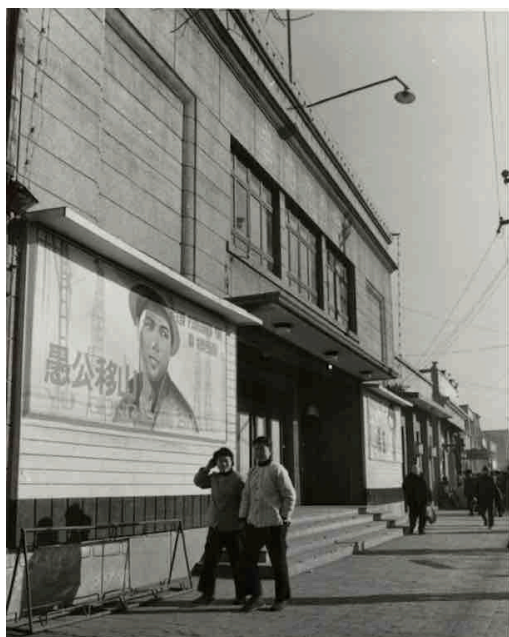
L'affiche de Yukong à Pékin, 1977 (collection de la Fondation Joris Ivens)

Pourtant, Yukong n'est jamais sorti intégralement en Chine ; lors de sa sortie à Paris, silence total du côté des Chinois, Joris Ivens avoue son « ultime déception » : « au moment de la sortie du film à Paris, la presse chinoise resta silencieuse. Plus Yukong avait du succès, plus la presse occidentale parlait du film, et plus ce silence devenait pesant. Il nous faisait mal (...) À Paris, nous essayâmes par l'ambassade d'en savoir davantage. En vain. C'était dur 869 ».