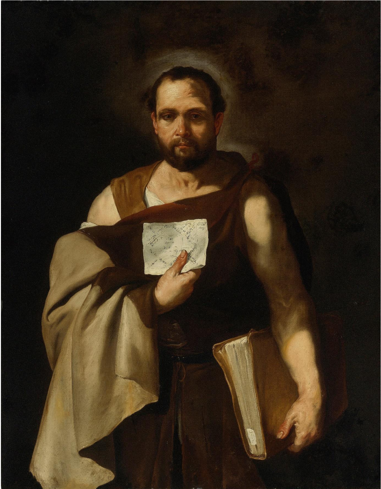
Luca Giordano, Un astrologue , seconde moitié du 17 e siècle, Huile sur toile, 122 x 96 cm, collection privée. Image issue du domaine public.