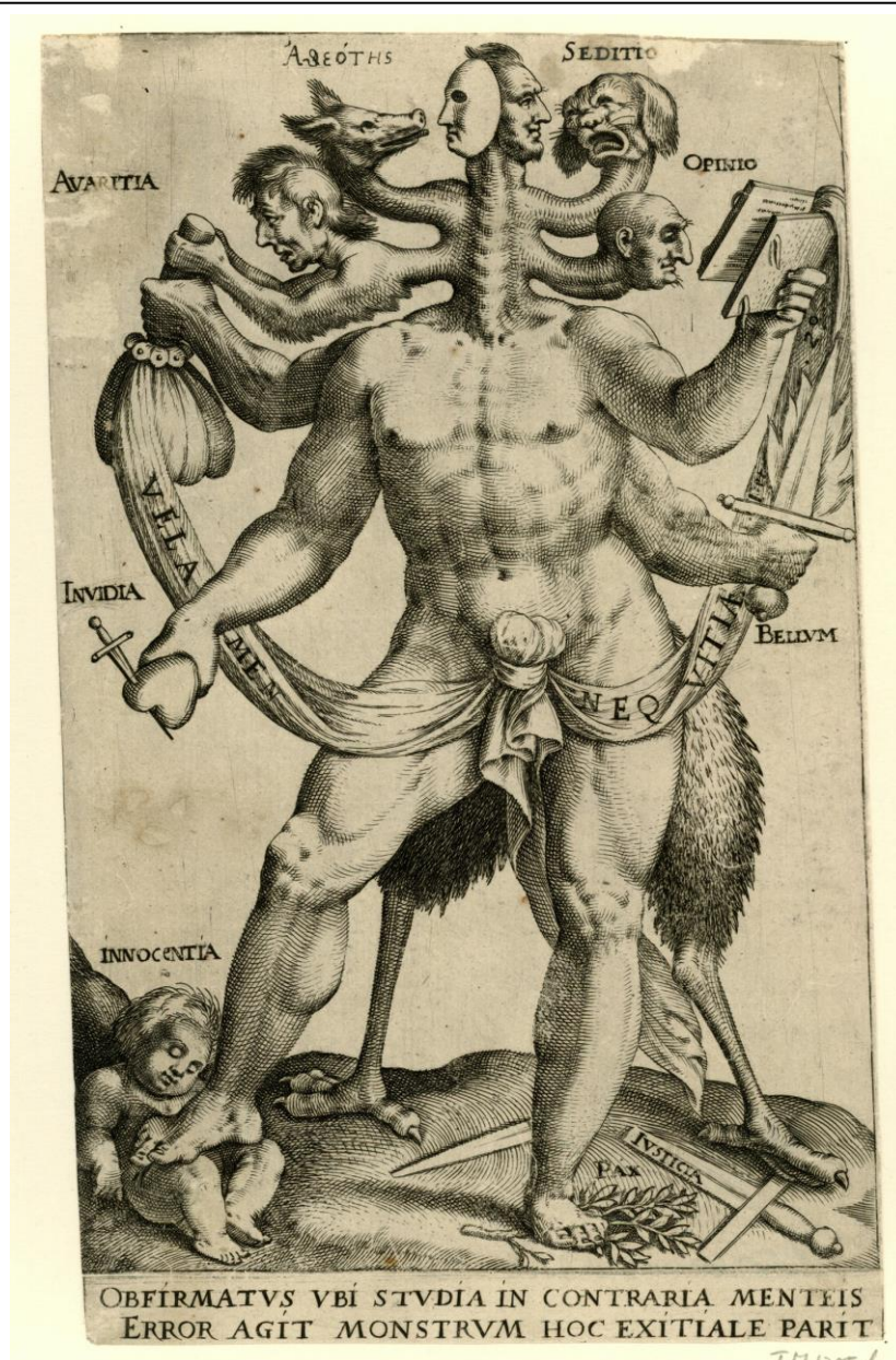
Allégorie des maux du temps , auteur anonyme, v. 1618, Rijksmuseum Amsterdam : RP-P-OB-77.294, @Rijksmuseum Amsterdam.

Dans ce contexte de méfiance généralisée, les astrologues doivent faire face à une critique radicale, celle de n'être pas sincère dans leurs protestations d'orthodoxie. Les affaires Ruggieri, Montalto ou Vanini jouent un rôle essentiel dans l'élaboration d'un lieu commun