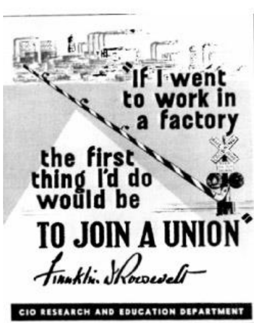
(« 1935 passage of the Wagner Act | National Labor Relations Board », s. d.)