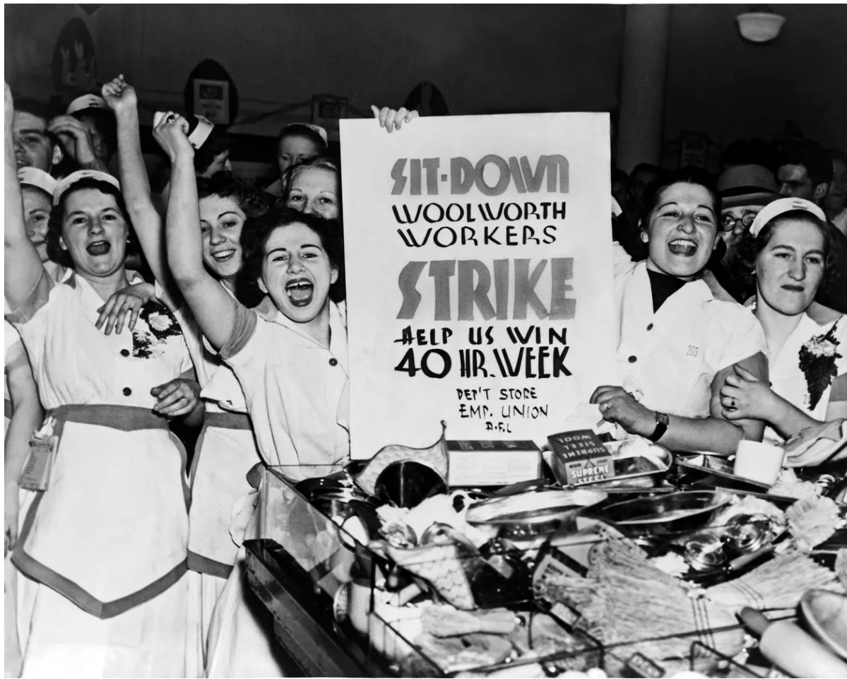
Woolworth's Employees Go On Strike in 1937.