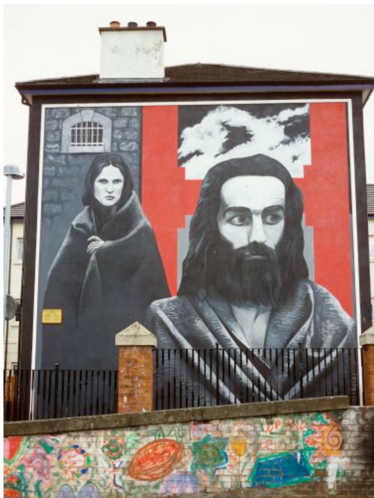
Grève de la faim

Peinture murale représentant l'un des grévistes de la faim, Raymond McCartney, et créée par le groupe des « Bogside Artists ». Située dans le Bogside de Derry, sur Rossville Street, elle fut inaugurée le 25 juillet 2000 1049 .