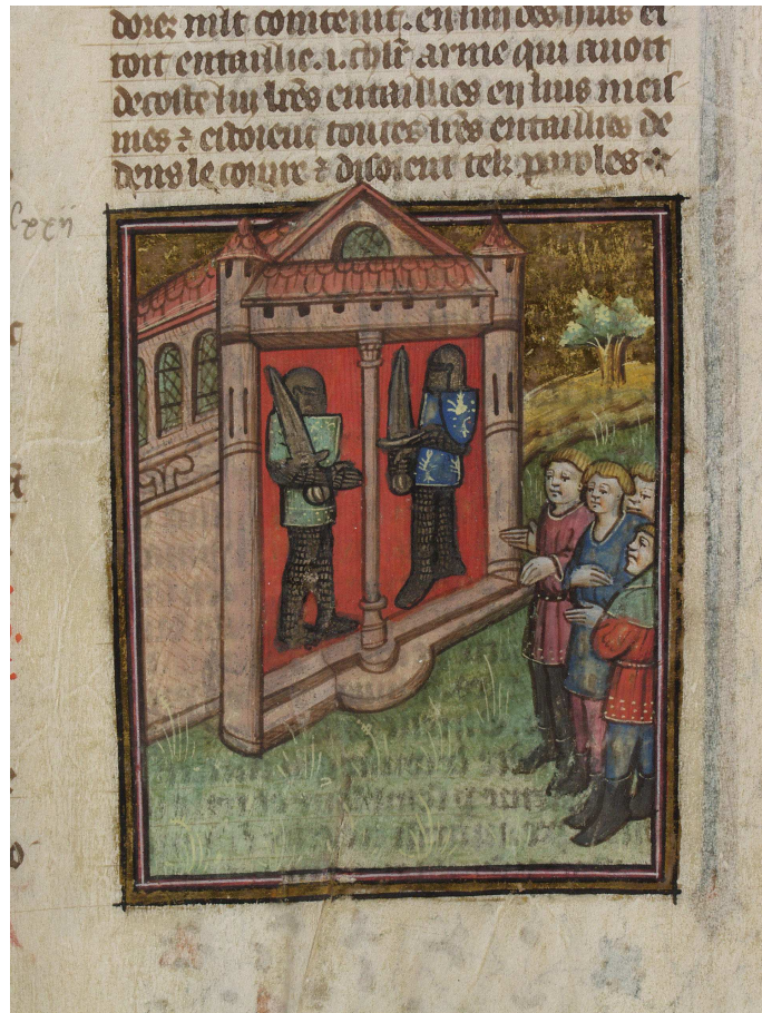
Bodmer, t. 2, fol. 3r° (image 34)