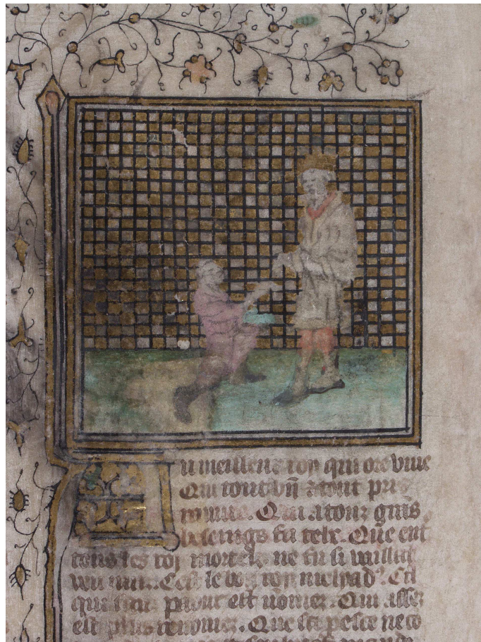
Bodmer, t. 1, fol. 299 v° (image 30)