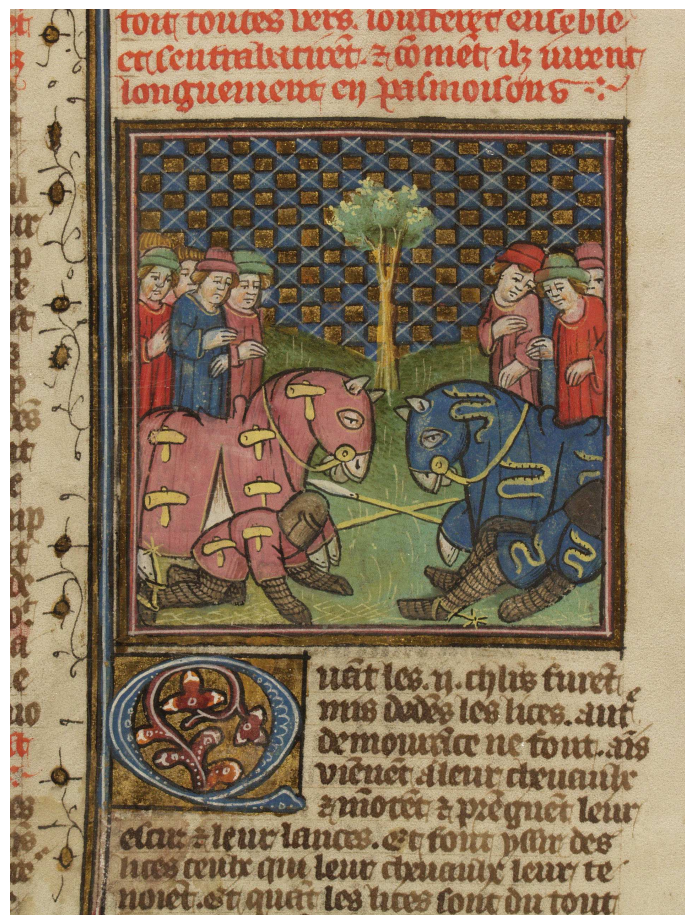
Bodmer, t. 1, fol. 310 r° (image 32)