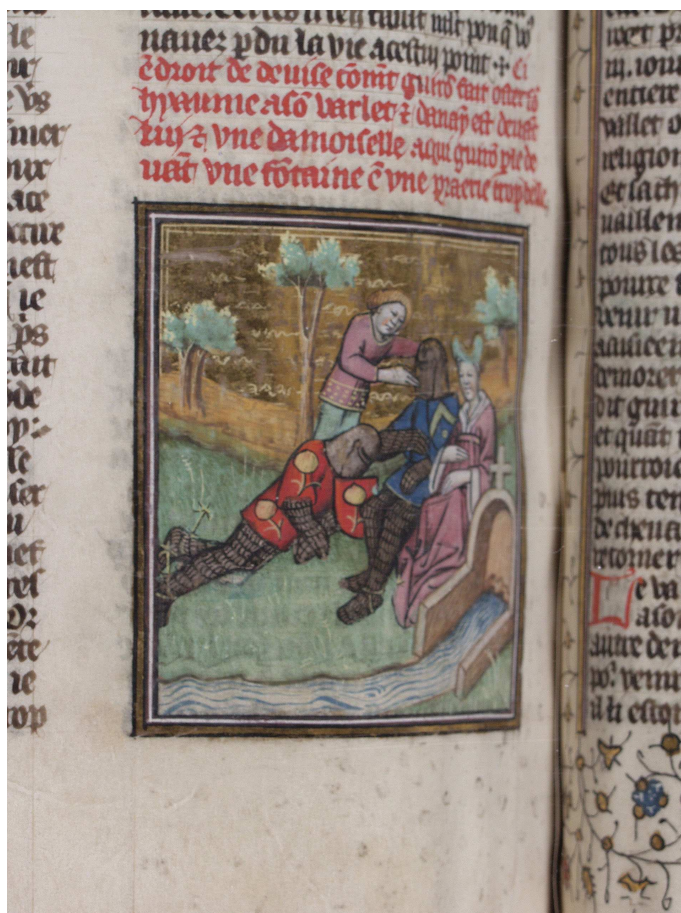
Bodmer, t. 2, fol. 208 v° (image 49)