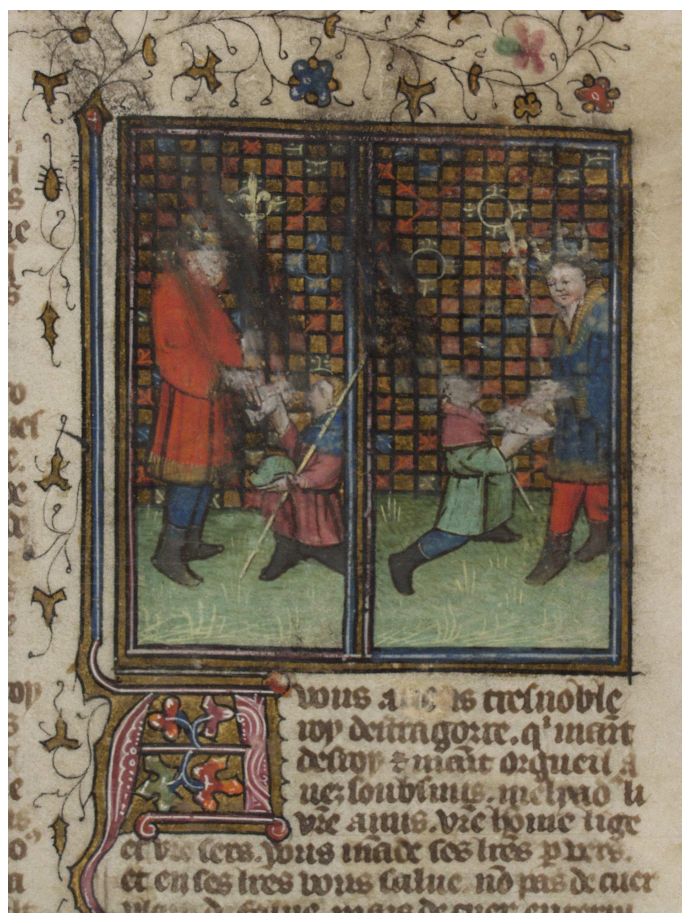
Bodmer, t. 1, fol. 298 r° (image 29)