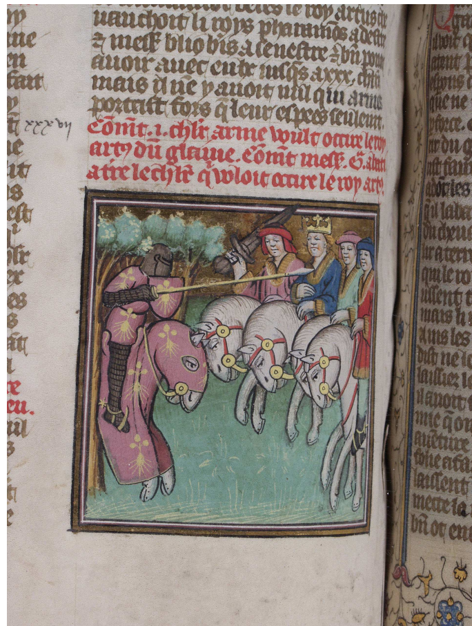
Bodmer, t. 1, fol. 127 v° (image 3)