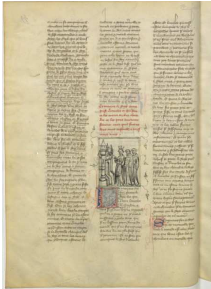
BnF fr. 340, fol. 49 v° (image 28)