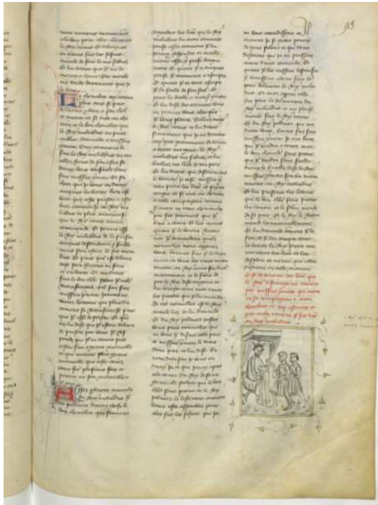
BnF fr. 340, fol. 93 r° (image 46)