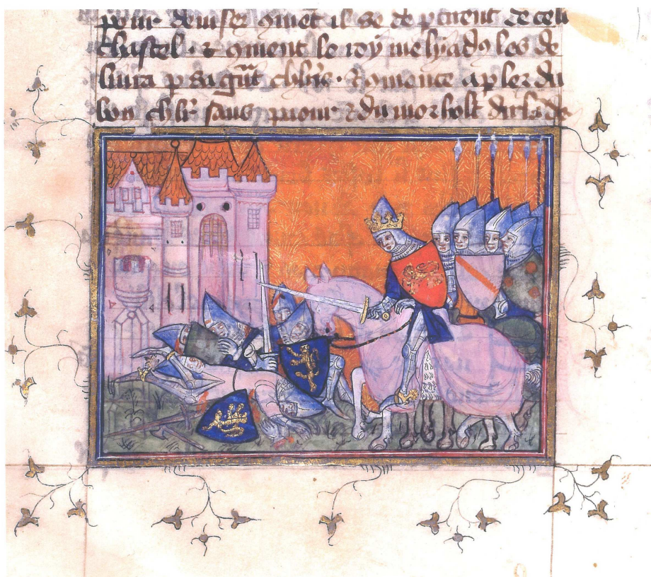
BnF fr. 338, fol. 70 v° (image 9)