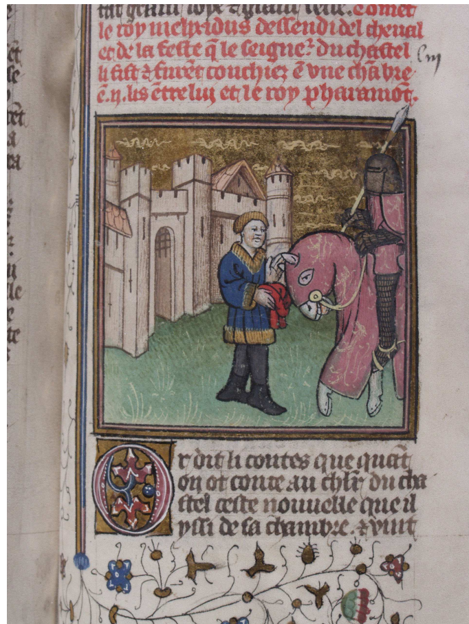
Bodmer, t. 1, fol. 230 r° (image 15)