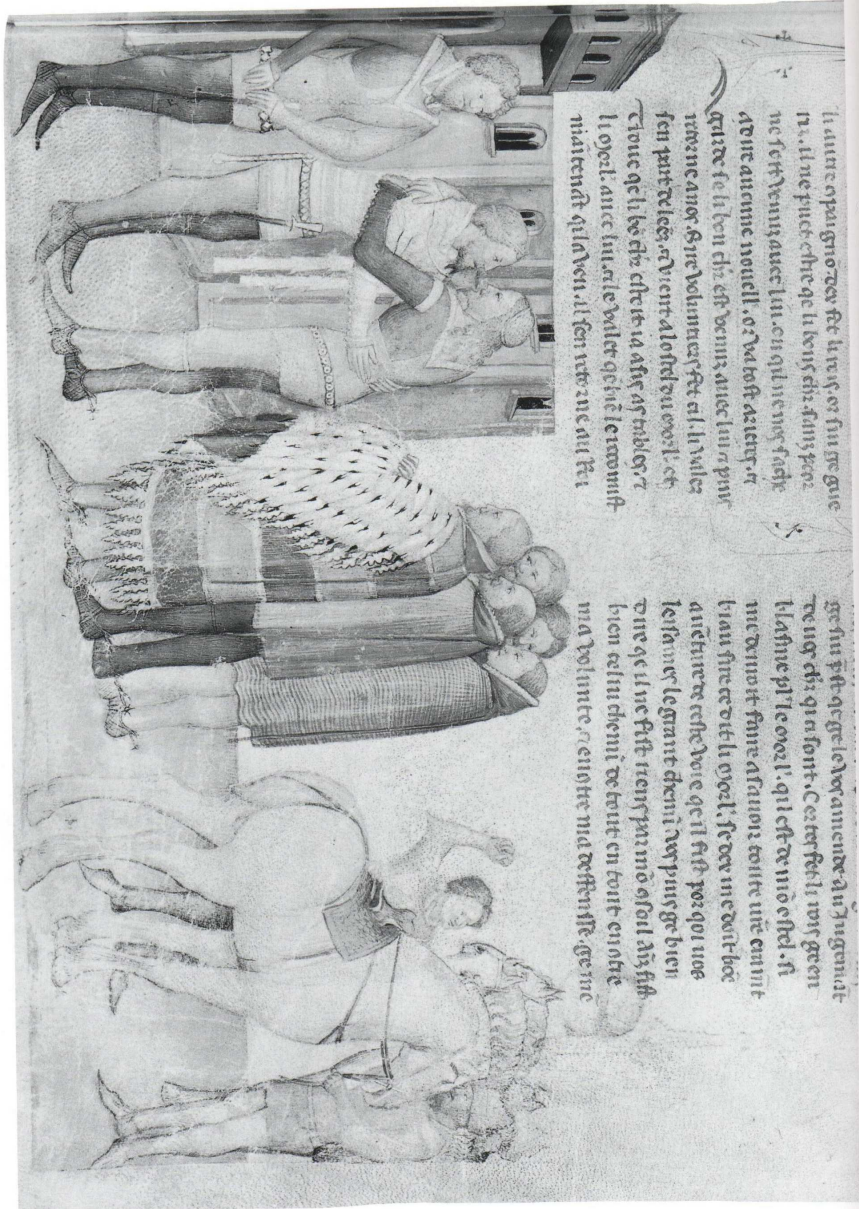
BnF fr. 5243, fol. 50 r° (image 67)