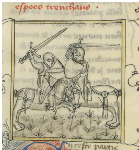
BnF fr. 340, fol. 67r° (image 36)