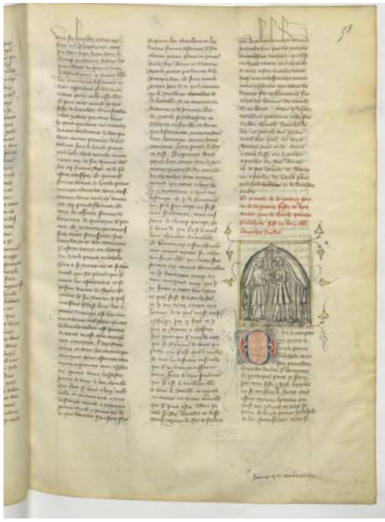
BnF fr. 340, fol. 58 r° (image 32)