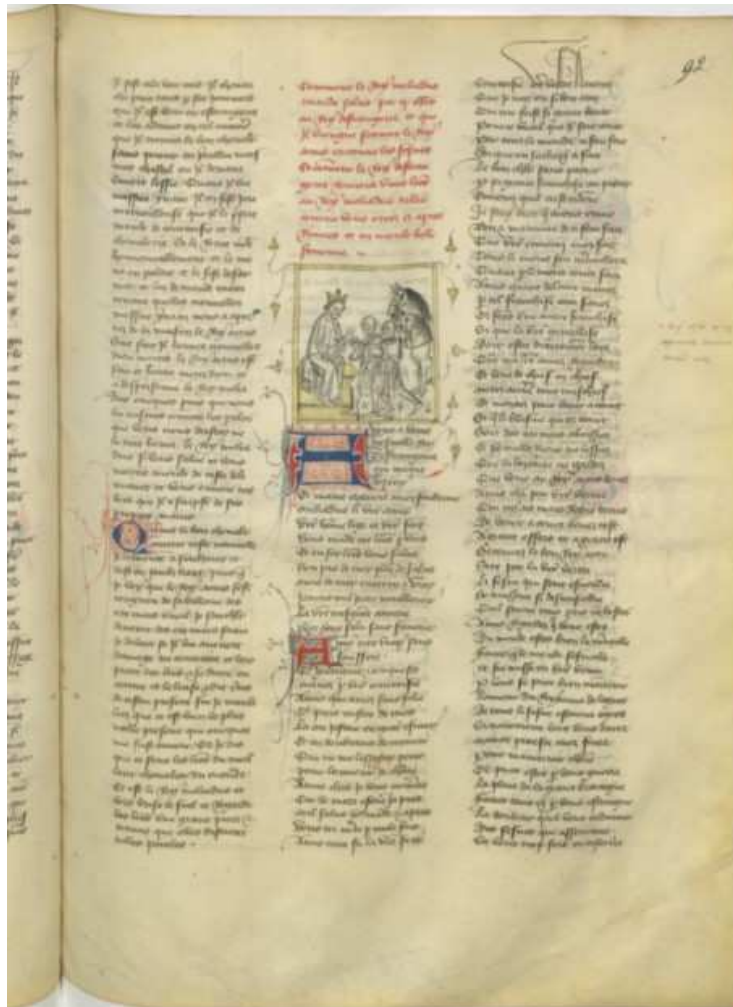
BnF fr. 340, fol. 92r° (image 45)