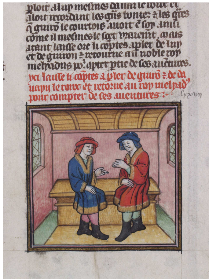
Bodmer, t. 2, fol. 75 r° (image 39)