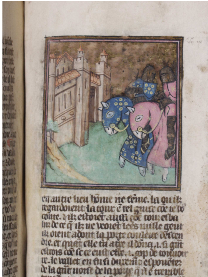
Bodmer, t. 2, fol. 213 r° (image 51)