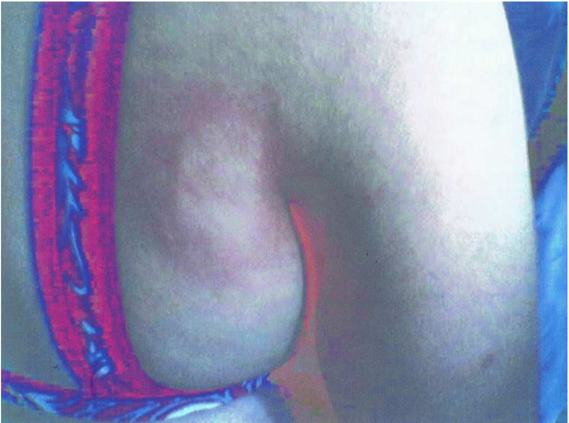
Triade de Lewis