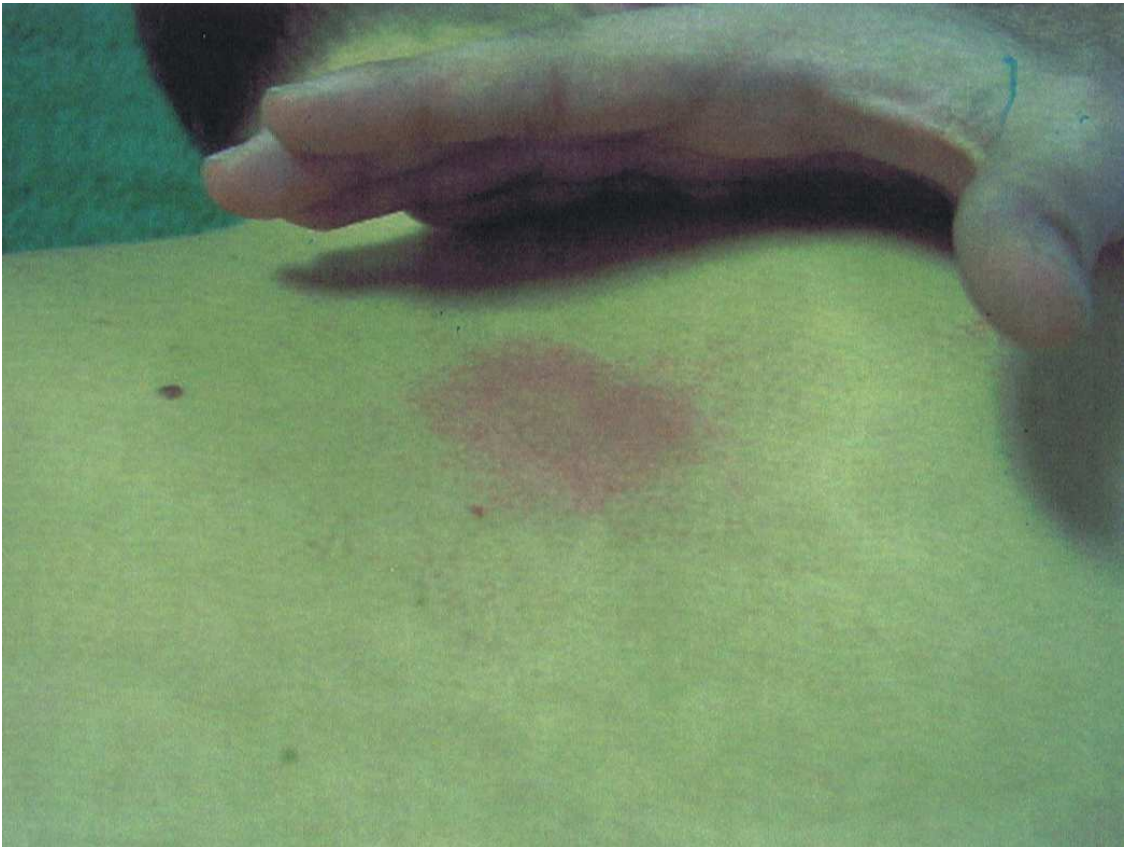
Triade de Lewis