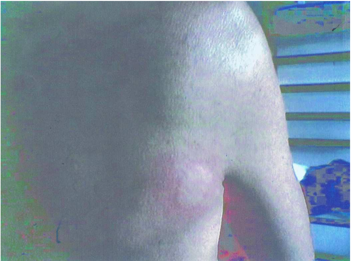
Triade de Lewis