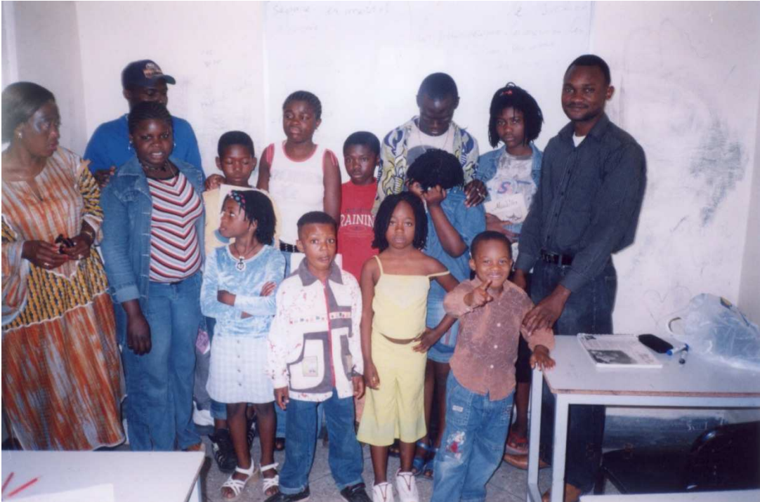
Classe autogéré dans le quartier de Hay Nahda (Rabat) par un collectif d'entraide