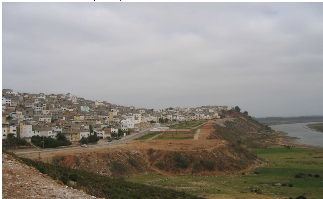
Quartier de Takadoum (Rabat)