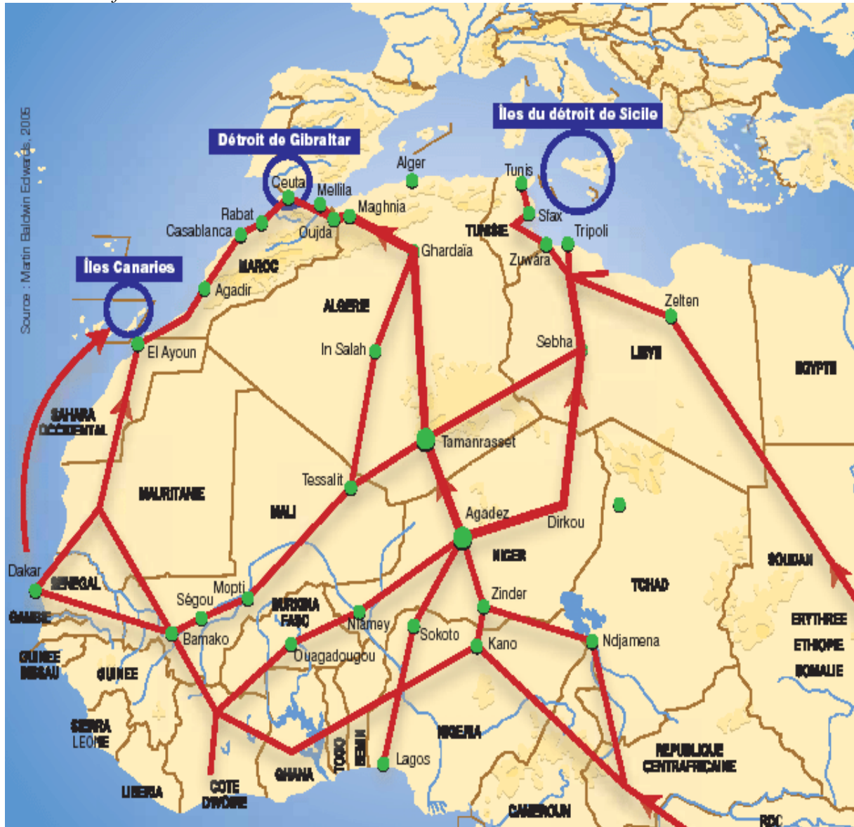
Les routes africaines de l'exil carte 1