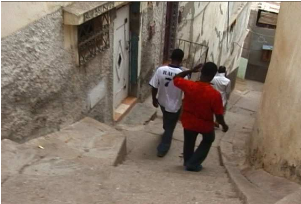
Photos prises par Charles Heller lors d'une enquête commune au Maroc pour une recherche visuelle mêlant artistes et chercheurs en sciences sociales sous la direction d'Ursula Biemann et de Brian Holmes, The Maghreb Connection. Movements of Life Across North Africa en 2006.