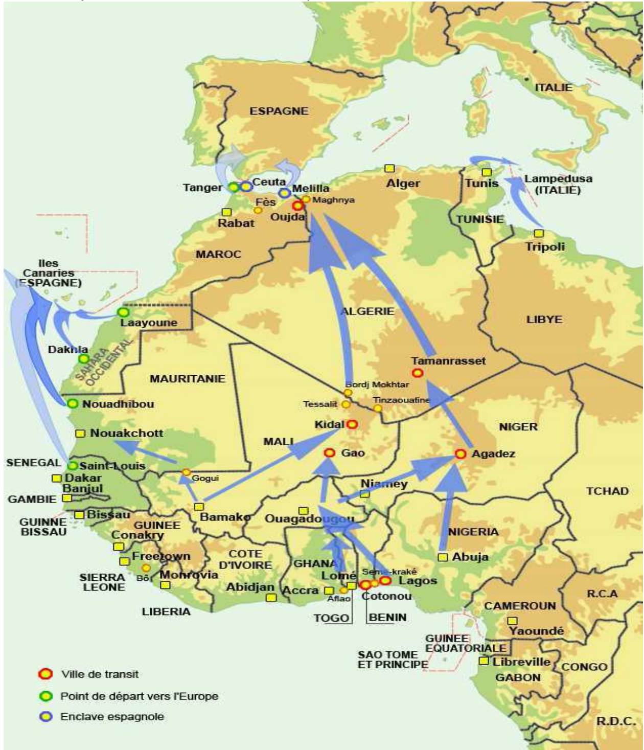
Carte : C. Wissing / RFI