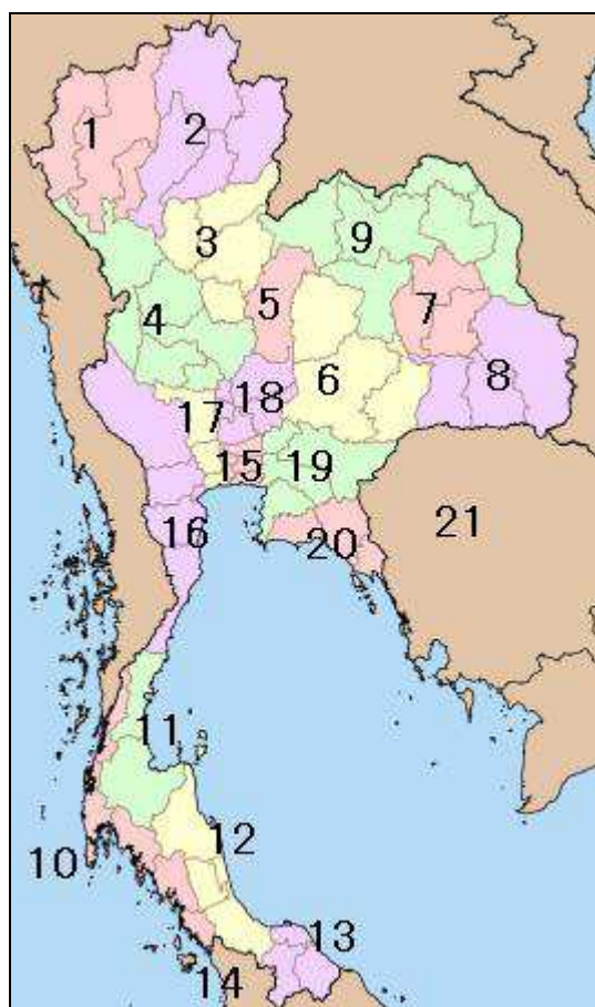
CARTE I : LES “MONTHON”