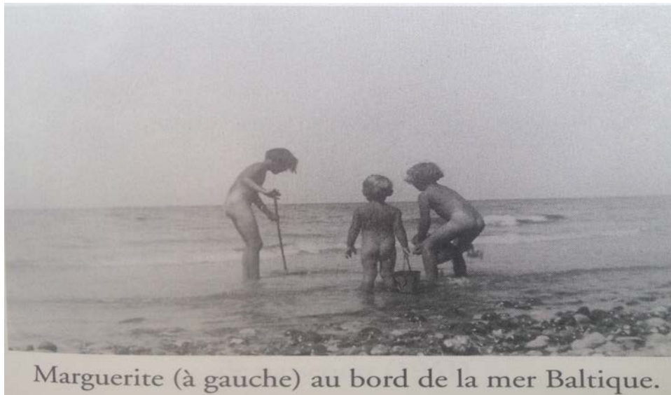
Photo extraite de Marguerite Andersen. Parallèles . Sudbury, Prise de parole, 2004, p.129.

Photo : présente l'enfance de Marguerite au bord de la mer Baltique.