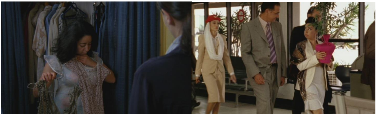
Une autre Djamila se dévoile dans Kaboul Kitchen