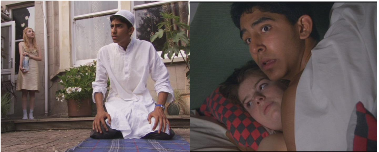
L'art de combiner amusements et prières Anwar dans Skins