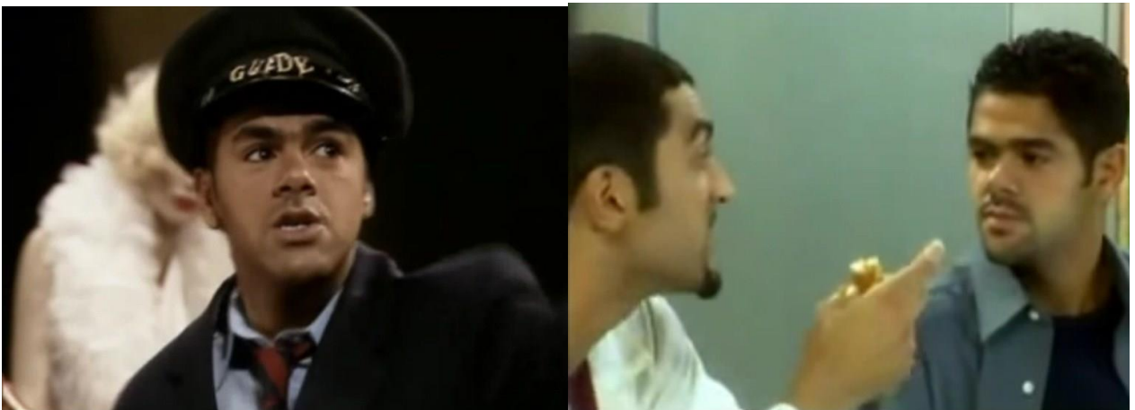
Astucieux, irrévérencieux et bavards Jamel et Sabri aiment jouer avec la langue française, Jamel Debbouze et Ramzy Bédia dans H