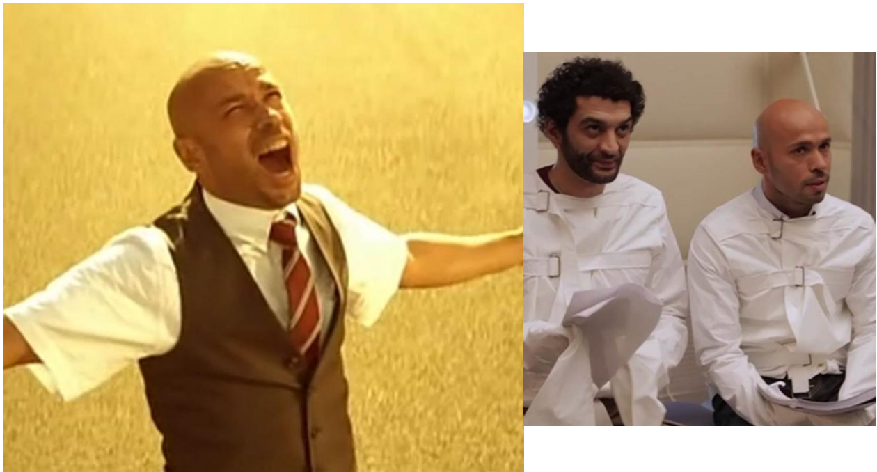
Autofiction et autodérision grinçantes dans Platane d'Éric Judor