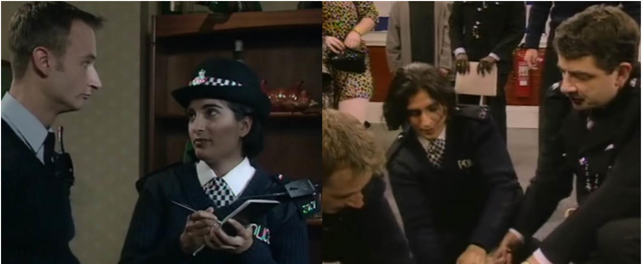
Policier avant tout l'officier Habib doit pourtant faire face aux préjugés dans The thin blue line