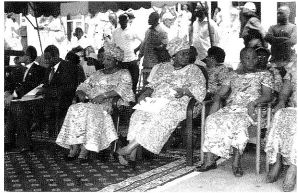
Le présidium de la Marche du 8 mars 2010