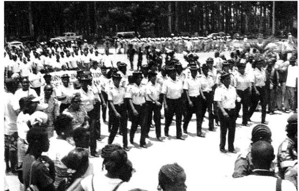
Les participantes à la Marche