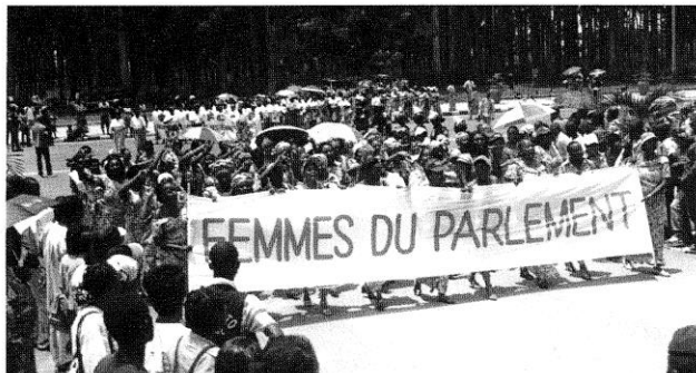
Les participantes à la Marche