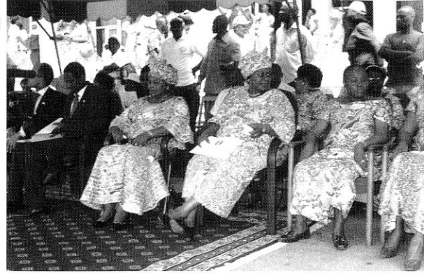
Le présidium de la Marche du 8 mars 2010