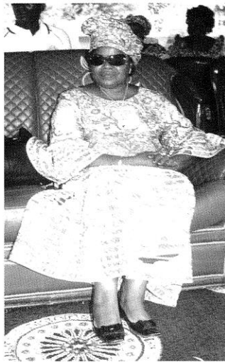
La Ministre assistant à la Marche