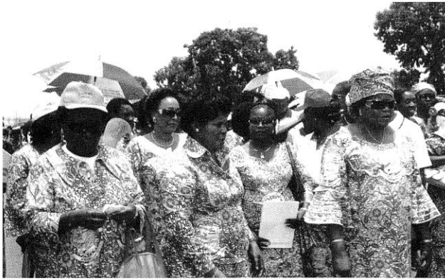
La Ministre avec les participantes à la Marche du 8 mars 2010