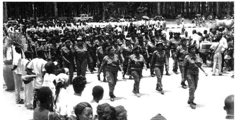
Les participantes à la Marche