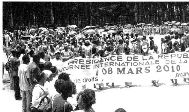
Les participantes à la Marche