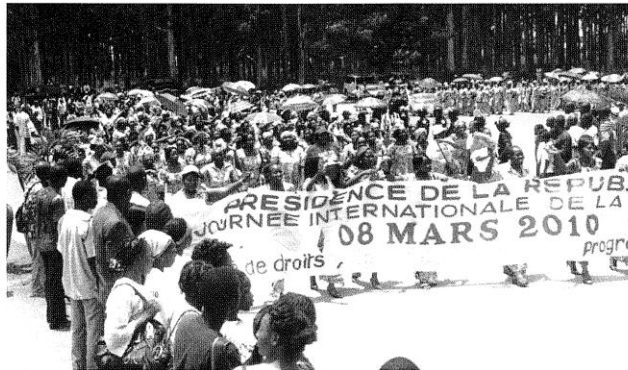
Les participantes à la Marche