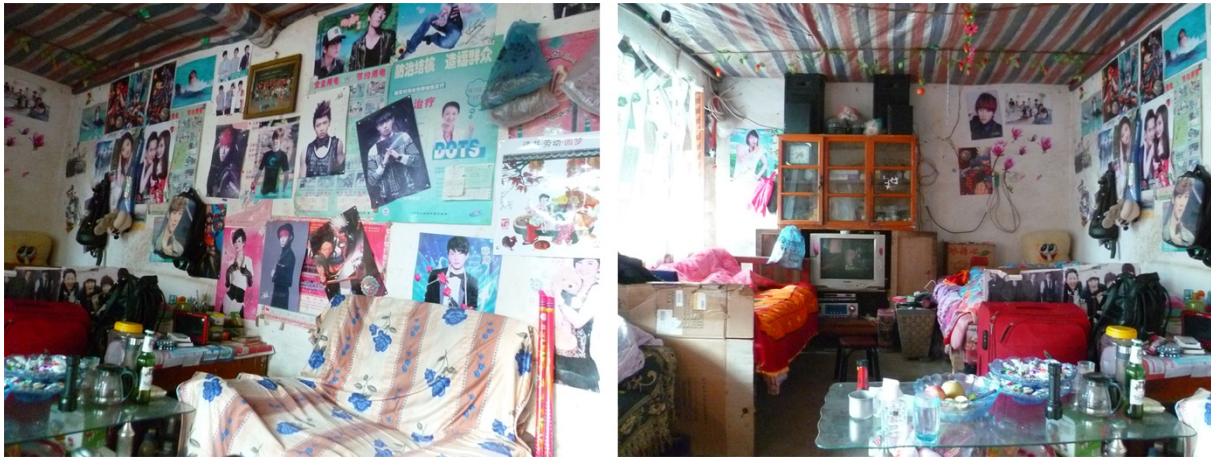
Illustration 5. Chambre de Ping dans sa maison parentale (décoration similaire à celle observée dans les chambres des dortoirs à Kunming)

La plupart des filles disposaient également de larges choix de tenues (vêtements et chaussures), bijoux et produits cosmétiques qui débordaient des placards. Ici et là, suspendus sur des cintres aux quatre coins des chambres, les vêtements fraîchement lavés à la main étaient mis à sécher. Plusieurs d'entre elles cultivaient des plantes dans des bacs de polystyrène posés sur les rebords des fenêtres : avocatiers (germés à partir de noyaux récupérés au café-restaurant), basilic, ail, plantes herbacées ( qingcai utilisées sautées ou bouillies dans les soupes) etc. Certaines chambres étaient plus appréciées que d'autres car plus lumineuses, plus spacieuses, mieux ensoleillées et agrémentées de balcons. La vie en colocation avec des amies plaisait beaucoup aux plus jeunes, le quartier remportait l'adhésion de la grande majorité notamment pour son dynamisme et pour la proximité avec le lieu de travail. Pour des raisons économiques, toute autre forme de logement était rarement envisagée. En effet, les loyers étaient rarement inférieurs à 1000 yuan par mois dans le quartier du Lac Vert de Kunming (souvent payables à l'avance au semestre ou à l'année), et les salaires de base (sans les primes) au café-restaurant étaient de 1600 yuan (ou 2000 pour les managers). Ceci rejoint les résultats avancés par d'autres auteurs montrant que les dortoirs sont rarement un choix, même s'ils peuvent être variablement appréciés en fonction de leur qualité (Lieber 2012; Pun 2007).