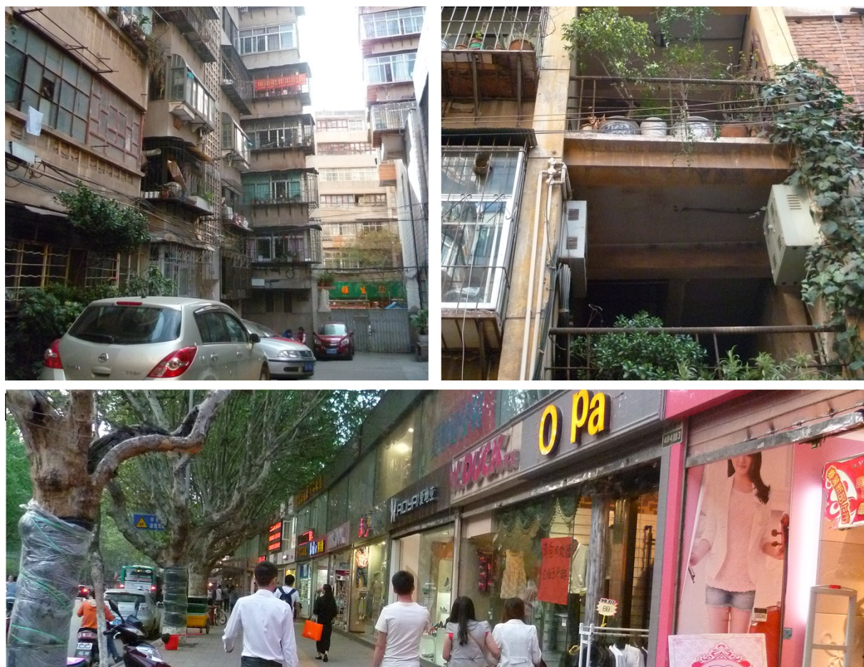
Illustration 4. Immeubles et rue commerçante du quartier de résidence des employées

La zone locative dans laquelle ils se situaient était particulièrement prisée en raison notamment de la proximité du Lac Vert, de l'université du Yunnan, de nombreux commerces, bars et café-restaurants. Les appartements comptaient deux à trois chambres (de 15 à 20 m 2 , chaque chambre étant la plupart du temps partagée par deux employées), une salle d'eau étroite (toilettes « turques » et robinets d'eau chaude et d'eau froide, plusieurs bacs et bassines de diverses tailles), un coin cuisine, des balcons. Les mobiliers et les décorations variaient en fonction des occupantes, mais on retrouvait souvent chez les plus jeunes des murs couverts de posters de jeunes garçons ( shuaige littéralement « beau gars ») stars de télévision ou de chansons de variété, des photos de sorties entre amies, de grosses peluches aux couleurs vives sur les lits, lesquels faisaient face à des postes de télévision vieilliss.