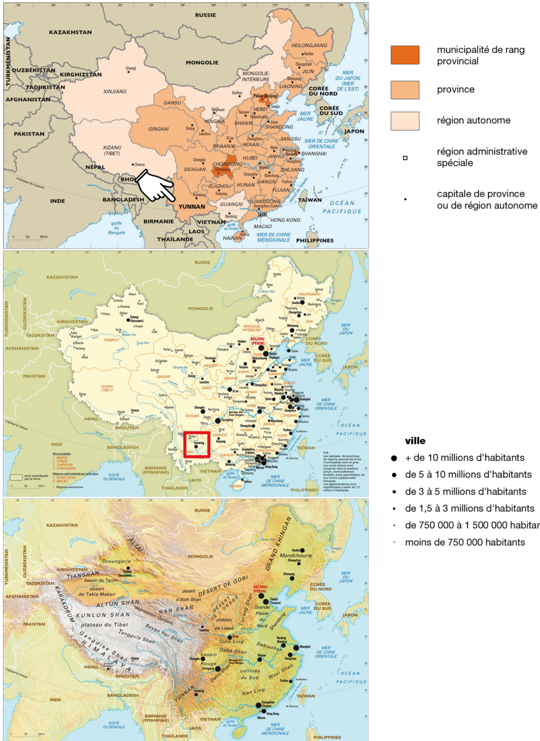
Illustration 1. Cartes administrative et physique de la Chine

Le Yunnan est une province du sud-ouest de la Chine bordée par – du nord au sud dans le sens horaire – le Tibet, le Sichuan, le Guizhou et le Guanxi pour les provinces à l’intérieur du territoire chinois, et pour les pays frontaliers le Vietnam, le Laos et la Birmanie.