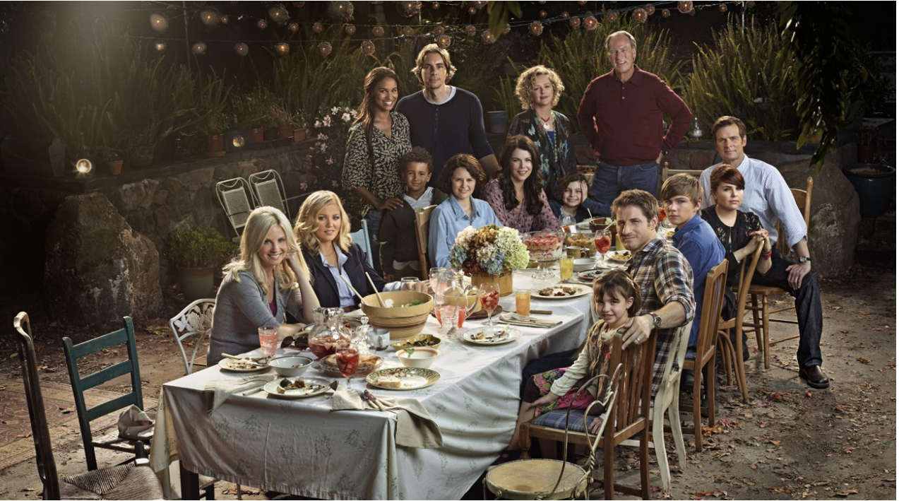
3. La famille Braverman (Kristina, Julia, Crosby, Jasmine, Jabbar, Haddie, Sarah, Camille, Zeek, Adam, Aber, Drew, Joel et Sydney) - Parenthood .