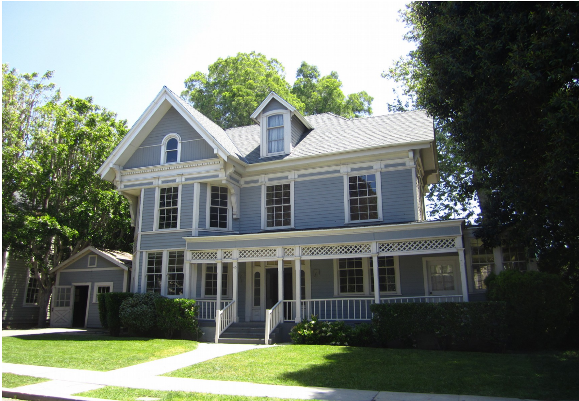
5. Le foyer de Lorelai et Rory Gilmore à Stars Hollow, Connecticut.