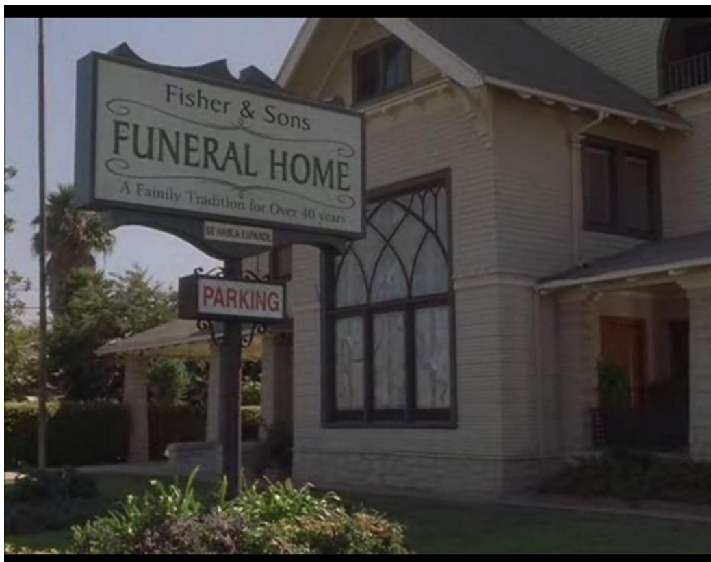
9 et 10. Le foyer des Fisher, à North Hollywood.