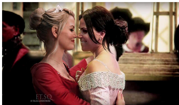
Illustration 4 : « "Dance with me." "But everyone is looking..." "Let them stare." », Emma & Tilda , 2 mars 2017, https://et-sq.tumblr.com/post/157899940584/dance-with-me-but-everyone-is-looking-let . Accès 26 juin 2018.

Les illustrations 3 et 4 témoignent d'un cas de manipulation « simple », par quoi nous comprendrons le montage d'images à partir de captures d'écran ici exclusivement extraites de différentes scènes de la série Once Upon A Time . Les manipulations de ce type brossent le même portrait que les dessins que nous mentionnions plus haut et l'aisance relative dans leur exécution permet leur prolifération. Les sources primaires pour construire les nouvelles images ne proviennent pas nécessairement de l'univers de départ dans lequel les fans préfèrent pour la plupart laisser les personnage ; ils piochent dans les différents ouvrages audiovisuels à leur portée, qu'il s'agisse d'autres séries ou films auxquels les acteurs qui prêtent leurs apparences aux personnages concernés auraient participé ou de productions pourtant non pertinentes au vue du projet à réaliser, à savoir une représentation inédite crédible, visuellement analogue à la série de départ. Toute image photographique et filmique est envisageable à partir du moment où les acteurs de la nouvelle source partagent suffisamment de caractéristiques physiques avec ceux de la source de départ pour être confondus. C'est ainsi que l'on peut retrouver dans une « manip » des bribes familières, comme la silhouette ou le corps sans tête (ou à défaut, dont le visage est dissimulé) de personnages d'autres productions.