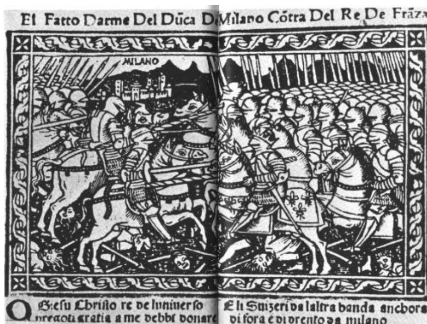
Xilografia dal "Fatto d'arme del duca di Milano" 1522