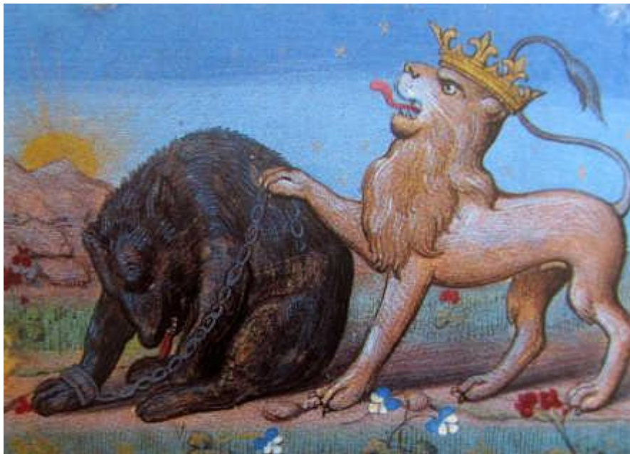
F. I. Rex Franco. Pri. Domitor Helvetior (épigraphe au tour de la tête du roi dans une médaille frappée à l'occasion de la victoire)