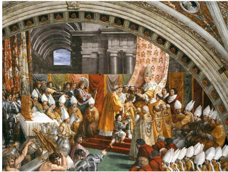
Incoronazione di Carlomagno Raffaello Sanzio 1516. Stanza dell'incendio di Borgo. Musei Vaticani

physionomie à François I er 563 . Sur un cartel s'affichent les mots : « Carolus Magnus Ro(manae) Ecclesiae Ensis Clypeusq(ue) », Charlemagne, glaive et bouclier de l'Église romaine. La ressemblance paraît telle que même Giorgio Vasari crut voir dans la peinture l'illustration du couronnement du Valois 564 .