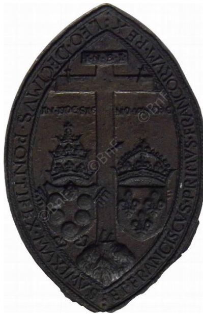
Matrice du sceau de la croisade. France, 1516-1517. Alliage cuivreux à patine translucide. Longueur : 57 mm ; largeur : 36 mm, hauteur : 18 mm. Bnf, département des Monnaies, Médailles et Antiques, inv. M 12

Premièrement, elle souhaite afficher la communion d'esprit qui doit exister entre le roi et l'Église. Deuxièmement, elle suggère une sorte d'égalité entre les deux autorités. Pour finir – élément qui nous intéresse de près ici –, ce sceau se fait véritable allégorie et propose un rapprochement incontestable entre le premier empereur chrétien et François I er . Ainsi faisant, elle investit de légitimité les prétentions au trône impérial que celui-ci manifeste déjà et, qui plus est, elle laisse sous-entendre la bénédiction pontificale 571 .