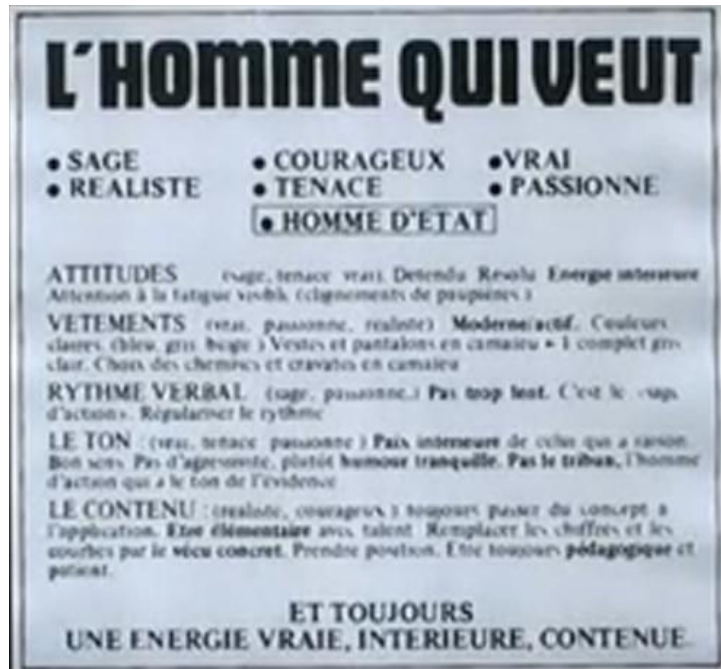
Figure 3 : Note synthétique de la stratégie communication de 1981 50

Dans le cadre de cette stratégie les publicitaires au service de François Mitterrand ont établi un profil de Valéry Giscard d'Estaing afin de mettre en lumière et d'accentuer ces défauts. Il en résulte une présentation de l'adversaire comme hautain, loin des réalités de la vie quotidienne, et technocrate, correspondant à l'incarnation du monarque disposant du pouvoir absolu, semblable ainsi à Louis XV.