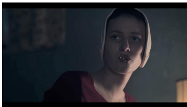
Ofglen/Emily avant son procès, The Handmaid's Tale, (1.03).