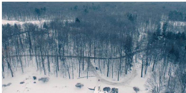
Vision finale de la trajectoire de June, The Handmaid's Tale, (2.10).

On peut dire alors que la forme sérielle démontre qu'il y a du jeu dans le genre, et que les processus d'émancipation des règles et contraintes peuvent être erratiques, ou montrés comme tels par le médium sériel. Cette image de la déroute est utilisée de façon récurrente dans The Handmaid's Tale , dont les très nombreux plans en plongée extrême permettent de mettre au jour une géographie précise de Gilead : l'image de la déroute est de nouveau convoquée lors de la fuite des handmaids , des Marthas et des enfants auxquels June permet de s'échapper de Gilead à la fin de la troisième saison (3.13). Les trajectoires des personnages dans les bois, filmés depuis le ciel, forment un dédale dans la forêt, et installent chez le spectateur un doute quant à la réussite du plan porté par June. Ces images font elles-mêmes écho à l'échec du plan des époux