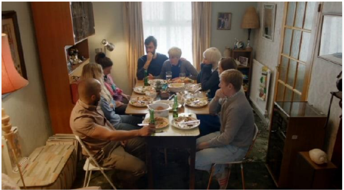
Le groupe à la table du repas, This Is England '90, (3. 03)