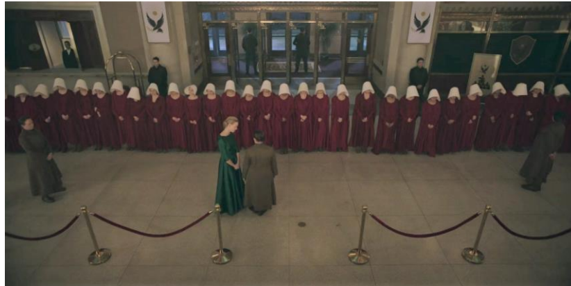
Handmaids alignées, The Handmaid's Tale (1.06).

impositions vestimentaires. A l'instar des personnages féminins de The Handmaid's Tale , ceux d' Orange is the New Black doivent se conformer aux normes pénitentiaires. Les femmes sont soumises aux fouilles des gardiens de la prison et aux contrôles quotidiens. C'est donc l'espace privé du corps qui est envahi par les règles pénitentiaires : le maintien d'une posture de respect et de soumission, l'acceptation d'une potentielle invasion de l'espace corporel menaçant chaque instant dans l'enceinte de Litchfield. Aux injonctions de respect des gardiens et du système pénitentiaire répondent en effet des façons de se tenir (droite, les bras le long du corps, le regard fixe), et des manières de parler.