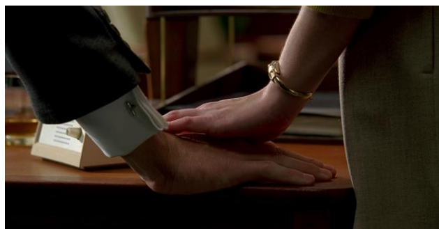
Peggy attrape la main de Don, Mad Men, (1.01).