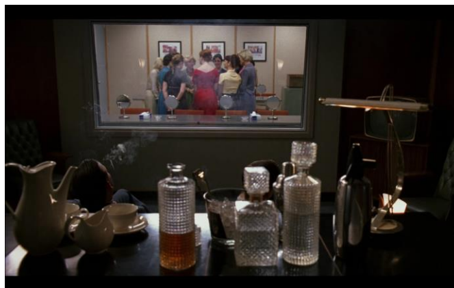
Les hommes de sterling Cooper font passer des tests aux secrétaires de l'agence, Mad Men, (1.06).

Plus que la nouvelle de cette demande déplacée, c'est l'absence de Joan lors des discussions qui interpelle cette dernière, d'autant qu'elle s'est menée en présence de deux de ses amants. Les sept saisons de Mad Men regorgent d'exemples qui soulignent l'objectification à laquelle les femmes sont soumises, et qui fait narrativement de celles-ci tour à tour les cobayes et les victimes des hommes de l'agence – comme lors du test des rouges à lèvres Belle Jolie, où les hommes sont montrés en spectateurs pervers des essais du produit (1.06). Le motif récurrent de l'exclusion genrée est donc porté à son paroxysme lors de cet épisode, où l'éthique personnelle et la vie sexuelle de Joan sont discutées en son absence. Ce qui semble motiver Joan comme Peggy dans leurs décisions, c'est bien la possibilité d'une gestion plus démocratique de l'agence, si ce n'est plus paritaire. Dans son compte-rendu de l'épisode, et face à la lourde décision de Joan, qui passe finalement la nuit avec l'homme envoyé par Jaguar, la journaliste Emily Nussbaum déclare :