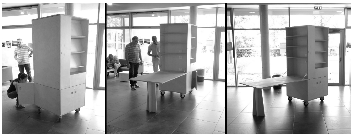
Illustration 2: Meuble "bureau" lors de sa livraison le 25 juin 2015, Université Paris Nanterre.

Concernant le deuxième, il s'avéra qu'il n'entrait tout simplement pas dans l'ascenseur. Nous n'avons pas non plus pu le stocker dans une des salles du rez-de-chaussée de la MDE, car il ne passait pas par l'encadrement des portes. Face à cette situation, j'ai dû revenir quelques jours plus tard, afin de changer les roulettes du meuble pour lui faire perdre quelques centimètres et pouvoir le monter – non sans mal – dans le local de l'AFEV.