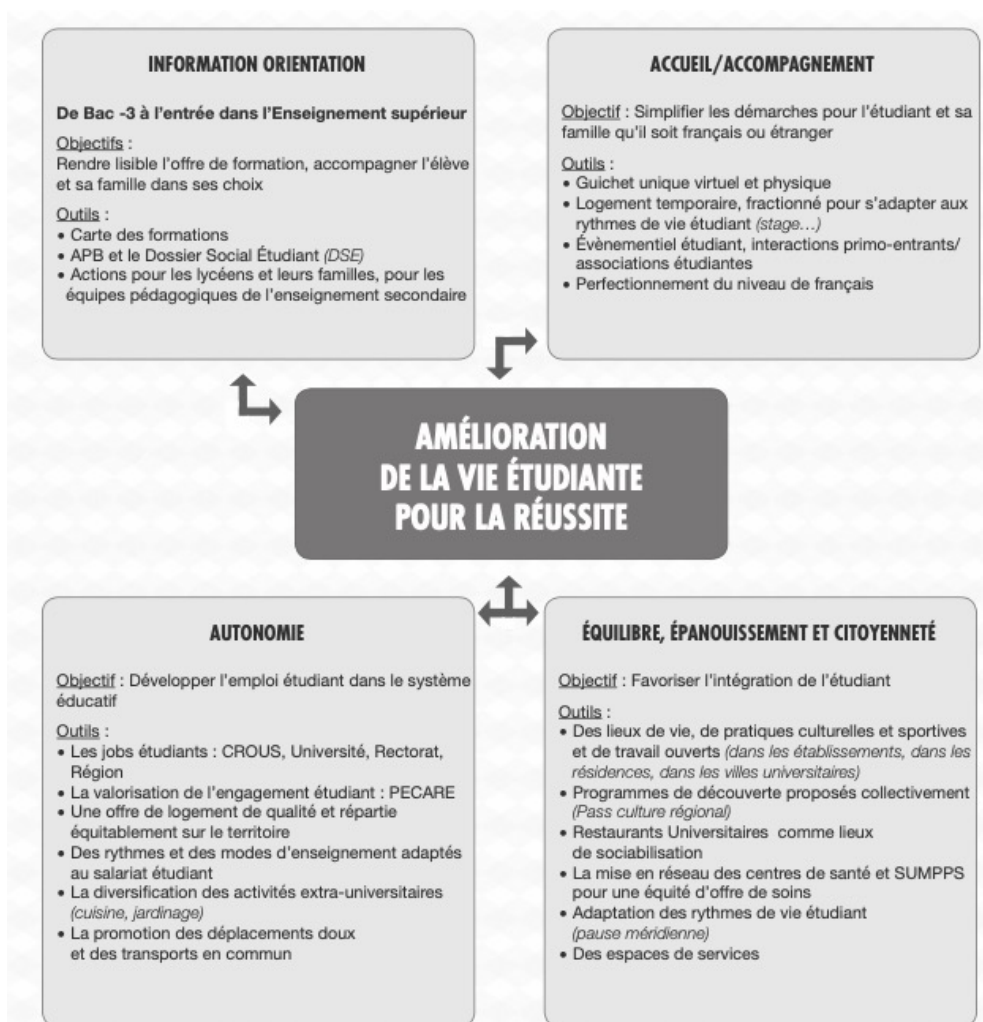
Illustration 1: COMUE Lille Nord de France, Schéma Directeur de la Vie Étudiante, 2016-2019, p 15

Les différentes recommandations élaborées dans le cadre de ce groupe de travail seront reprises dans le cadre de l'élaboration du Schéma Directeur de la Vie Étudiante (SDVE) de la COMUE pour la période 2016-2019. Le SDVE s'articule autour de quatre axes et objectifs en vue de l'amélioration de la réussite et de la vie étudiante :