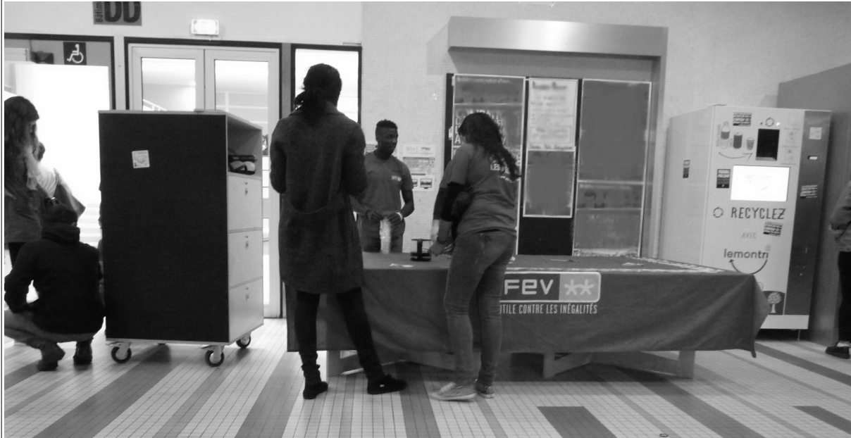
Illustration 3: Meuble "Fun- table de Coworking" recouvert d'une nappe de l'AFEV. Photo prise dans les couloirs de l'Université de Nanterre, 22 septembre 2015.

Après avoir été poussé – non sans mal – par des Services Civiques de l'AFEV dans un des bâtiments de l'université (heureusement à proximité de la MDE), trois personnes ont été nécessaires pour déployer le module prévu pour se transformer en une grande table. Les salarié-e-s m'ont par la suite expliqué qu'ils/elles ne s'en sont plus jamais servi, car bien trop encombrant et lourd à manœuvrer.