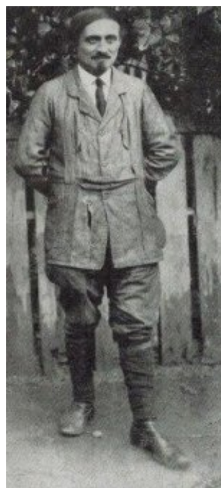
E. Armand (Lucien Ernest Juin)