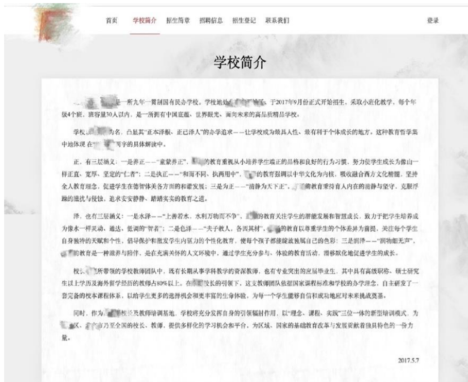
Figure 6 Page web d'École 33C

Ce genre de présentation sous forme textuelle se trouve dans les sites web de toutes les écoles de la catégorie A et aussi de la plupart des écoles de la catégorie B. Il y a aussi des écoles, comme École 53E (Figure 7), qui utilisent principalement les textes pour introduire des idées et les images pour illustrer et compléter les énoncés.