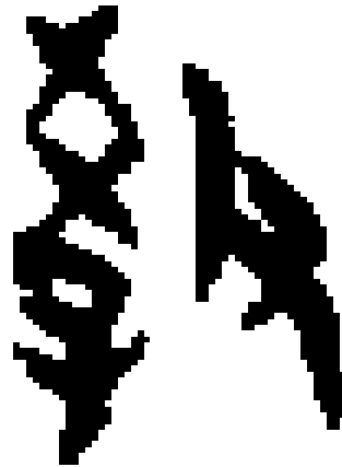
Figure 1 Écriture ossécaille de 教 jiao

Dans le Dictionnaire « 说文解字 (Expliquer les mots) », l'un des premiers dictionnaires chinois et qui analyse systématiquement des glyphes de caractères chinois et leurs sources, 教 Jiao signifie : « on suit ci-dessous l'exemple venu du supérieur ci-dessus ». En ce qui concerne Yu, sur son écriture ossécaille, nous pouvons voir une femme qui est en train de donner naissance à son enfant. Manifestement, à l'origine, 育 Yu porte une signification d'élever un enfant.