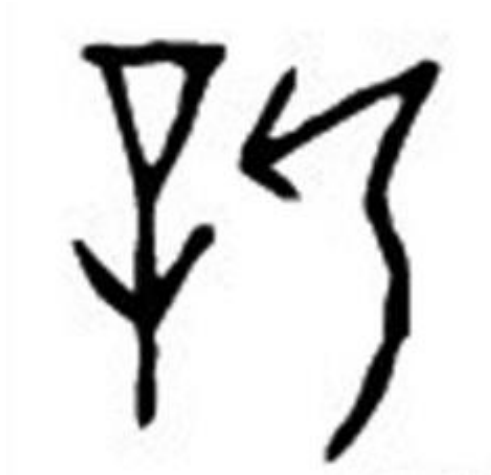
Figure 3 Écriture ossécaille de 新 Xin

couper en matériaux en vrac »(S. Xu & Xu, 1985, p. 472). La première coupe du bois s'appelle Xin . Dans l'écriture ossécaille de Xin , nous pouvons voir un arbre à gauche et une hache à droite visant à couper l'arbre. L'écorce des bûches est généralement grise et ridée, mais le cœur en bois est blanc et lisse. Couper du bois est dépouiller la peau ancienne et faire apparaître le rejeton.