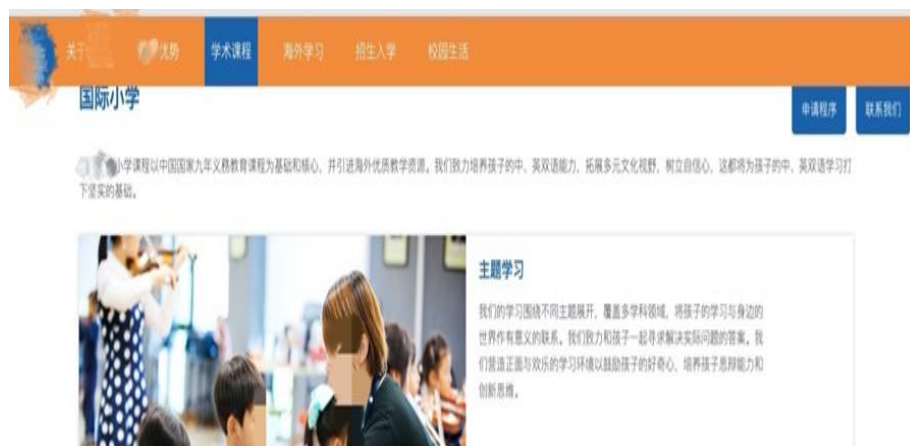
Figure 7 Page web d'École 53E

Ce genre de présentation sous forme textuelle se trouve dans les sites web de toutes les écoles de la catégorie A et aussi de la plupart des écoles de la catégorie B. Il y a aussi des écoles, comme École 53E (Figure 7), qui utilisent principalement les textes pour introduire des idées et les images pour illustrer et compléter les énoncés.