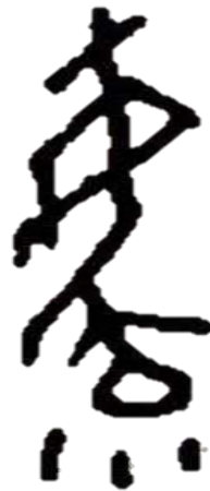
Figure 2 Écriture ossécaille de 育 yu

Dans le Dictionnaire « 说文解字 (Expliquer les mots) », l'un des premiers dictionnaires chinois et qui analyse systématiquement des glyphes de caractères chinois et leurs sources, 教 Jiao signifie : « on suit ci-dessous l'exemple venu du supérieur ci-dessus ». En ce qui concerne Yu, sur son écriture ossécaille, nous pouvons voir une femme qui est en train de donner naissance à son enfant. Manifestement, à l'origine, 育 Yu porte une signification d'élever un enfant.