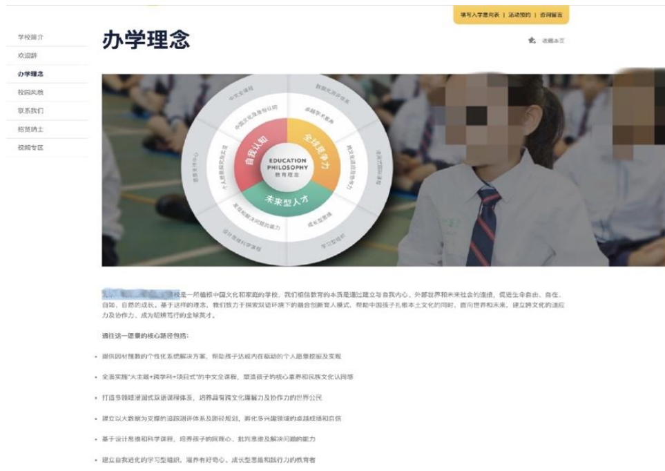
Figure 8 Page web d'École 51E

Mais cette manière de présentation est moins fréquente dans les écoles observées, nous le trouvons notamment dans les écoles de la catégorie D et E.