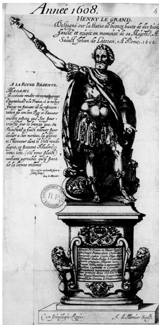
BnF, Clairambault 1127, fol. 4

Henri IV ne brandit pas un bâton de commandement mais le sceptre qui est dit « de Henri IV », différent de celui de Charlemagne, puisqu'il a été créé pour le sacre de 1594, reconnaissable avec sa fleur de lys à cinq pétales 158 . Comme l'a relevé D. Bodart, cette statue brandissant le sceptre avait pour but de représenter Henri IV comme héros de la foi catholique, image dont les gravures ont permis de diffuser l'image en France (cf. page suivante) 159 . Cette représentation peut être rapprochée du placard de thèse en 1606 au Collège romain, où Henri IV est représenté à l'antique dans un temple, la foudre en main, prêt à terrasser des créatures allégoriques 160 . Cependant, ce message est resté peu efficace à Rome vu la place reculée où la statue de Nicolas Cordier a été reléguée 161 . Malgré tout, le roi de France est resté très satisfait de ce témoignage francophile des chanoines du Latran 162 .