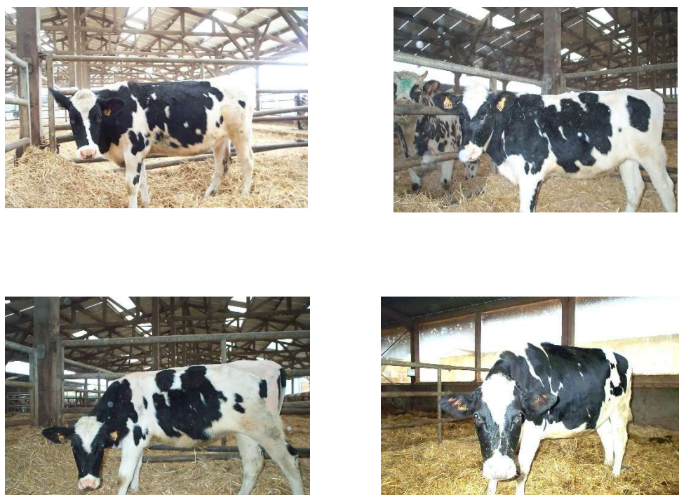
Figure 1 : La réalité des clones bovins de l'INRA en 2003-2009 (génotype 2251). De gauche à droite, en haut : vaches 0357, 0401, en bas : vache 0402 et vache donneuse 2251. (INRA, Bressonvilliers,)

Ce qui s'impose à la volonté de cloner, désirant un génotype identique et un phénotype très similaire, c'est la réalité des clones ( Figure 1 ). La réalité des clones, comme résultats du laboratoire variables et incertains et aussi comme êtres vivants à part entière ; Cette réalité des clones nous indique que les clones ne peuvent plus servir, en toute rigueur, de modèle de l'identité ni biologique car ce serait mensonger, ni génétique car, sans vérification poussée, cela serait trop risqué. En revanche, à travers l'étude des caractéristiques particulières des animaux clonés, émerge l'occasion de tester expérimentalement des questions fondamentales comme la part de l'épigenèse et de la génétique dans le développement et l'identité biologique d'un individu. Ainsi, les clones pourraient, comme nous allons le voir dans notre deuxième partie, servir de modèle de l'individuation biologique par les processus épigénétiques et adaptatifs qu'ils permettent de révéler.