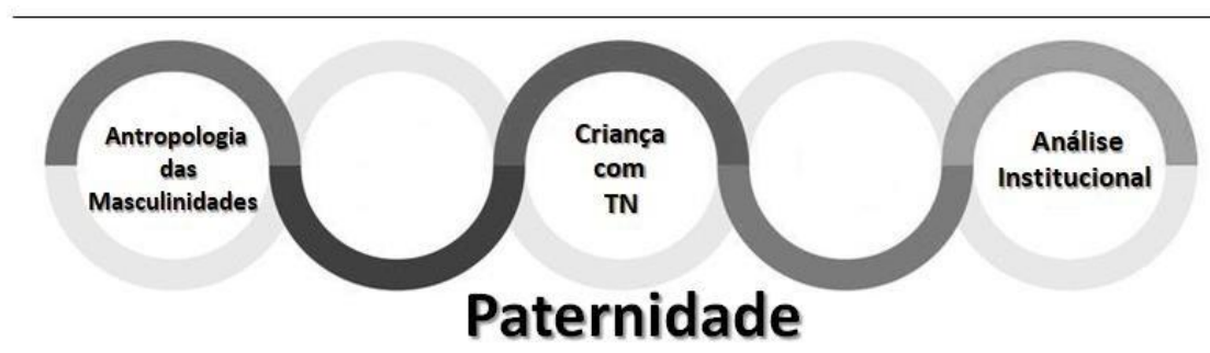
Figura 1 – Articulação entre as experiências paternas diante de crianças com transtornos do neurodesenvolvimento, na abordagem multirreferencial da Antropologia das Masculinidades e da Análise Institucional.

Assim, ancorados nas fundamentações teóricas da antropologia das masculinidades e da análise institucional supracitadas, assumimos que este estudo se encaixa num paradigma qualitativo e na abordagem da narrativa centrada na experiência, proposta por Squire (2012). É por meio da subjetividade que se revelam os sentidos “singulares” de cada experiência (CONNEL, 2009; POPE 2009; ARAÚJO 2016) e, para alcançá-las, é fundamental escolher metodologias capazes de particularizar o mundo paterno, conforme descrição na figura 1, abaixo.