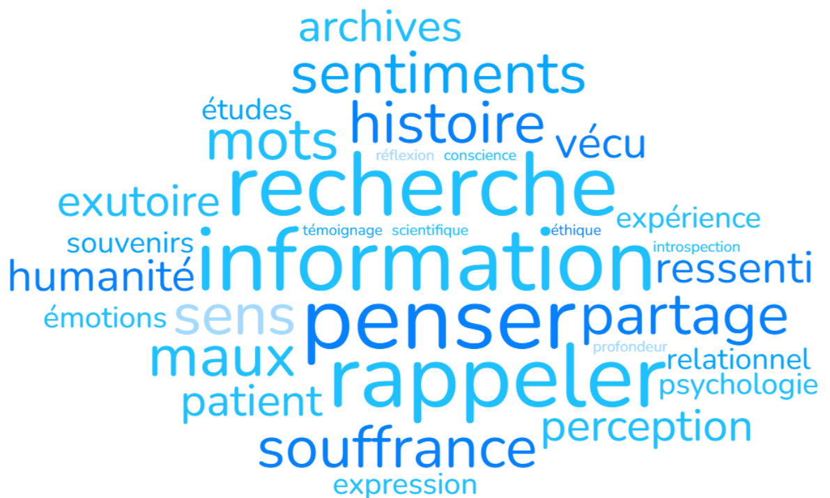
Figure n° 12. Nuage des mots recueillis sur les liens entre littérature et médecine d'après les étudiants

De manière générale, on observe que les mots rapportés renvoient plutôt aux champs lexicaux de la subjectivité et de l'intersubjectivité, lexique que les étudiants opposent au langage « professionnel », « technique » ou « scientifique ». Dans la perspective de séances multiples, il serait indispensable de définir avec eux ces mots (comme « humanité », « psychologie », « relationnel ») et leurs modalités de mise en scène littéraire.